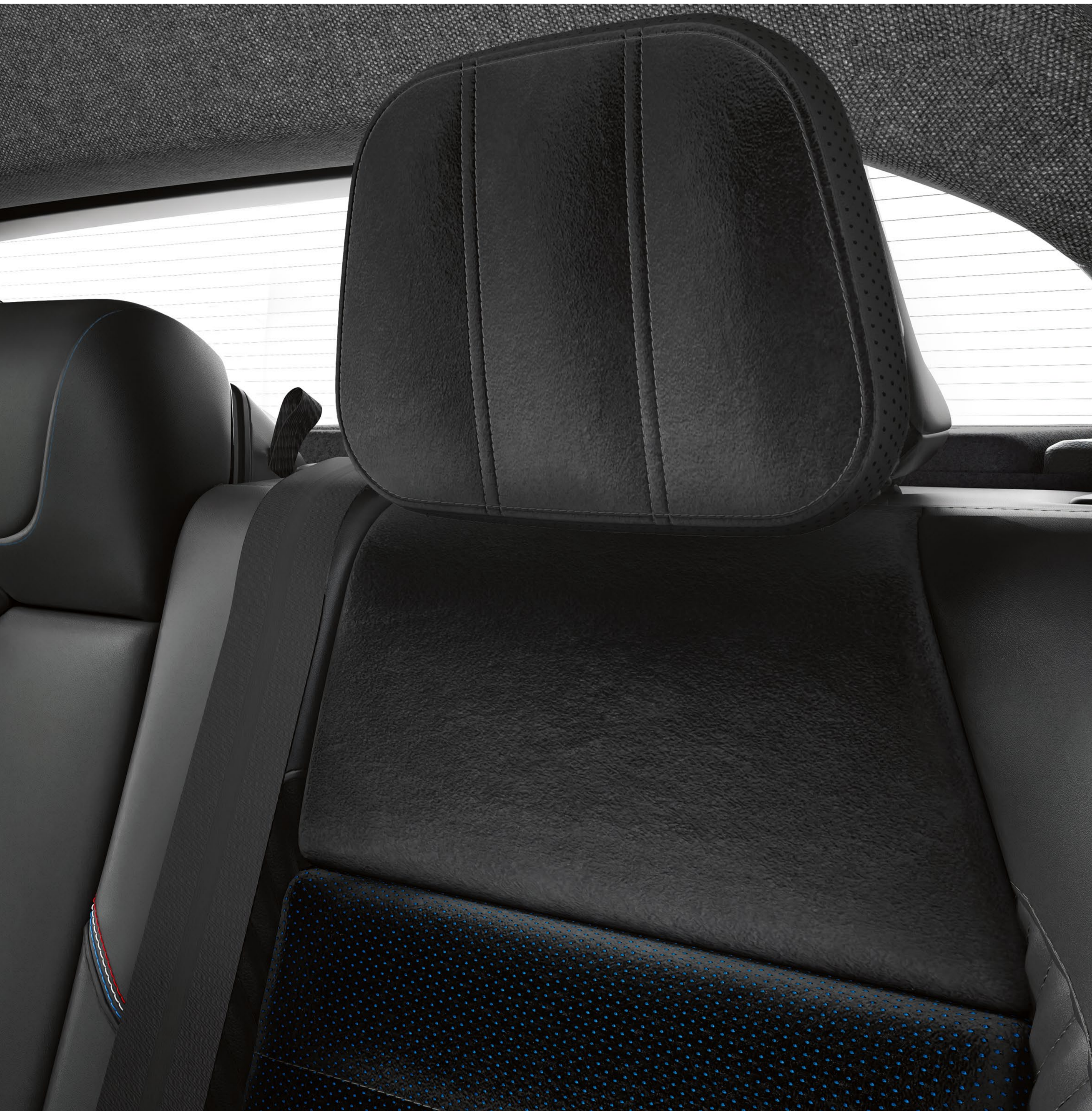
svarta kuddar med hög komfort på de bakre nackstöden

Nackstödsdynorna ger stöd och välbefinnande för passagerarna i baksätet, och tillför en elegant touch med sin Alcantara®-beläggning.