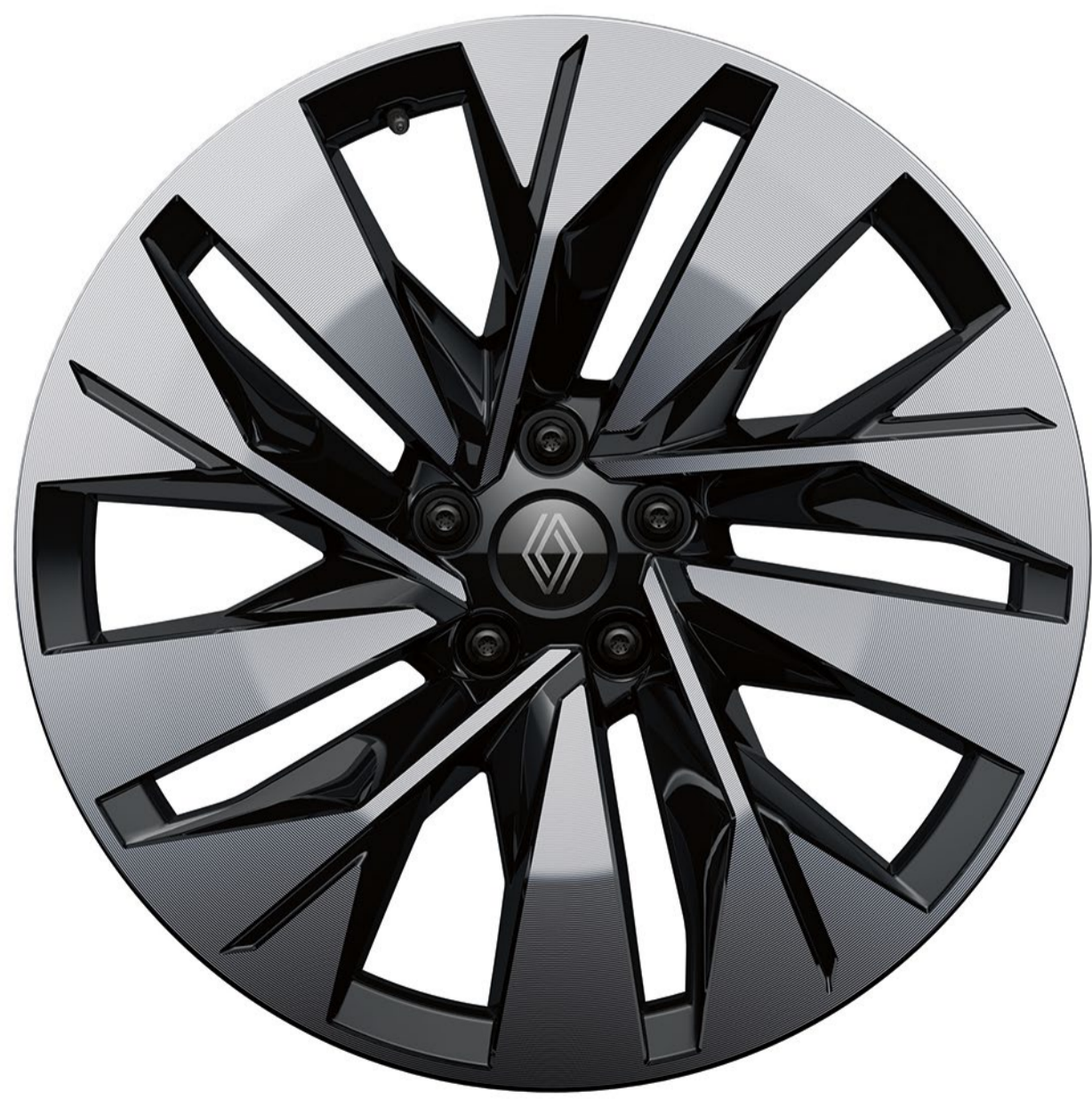
20 tums sonic lättmetallfälgar i svart diamantlook