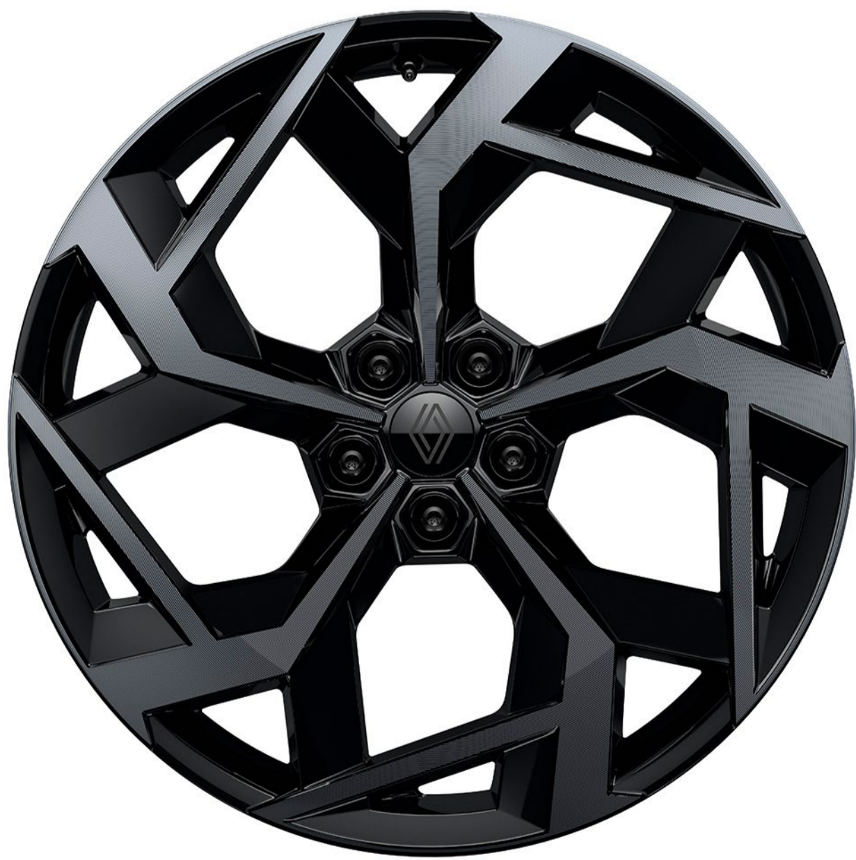
21 tums lättmetallfälgar i svart diamantlook och smokey grey

Stöldskyddsskruvar i stål ger förbättrat skydd för dina hjul.