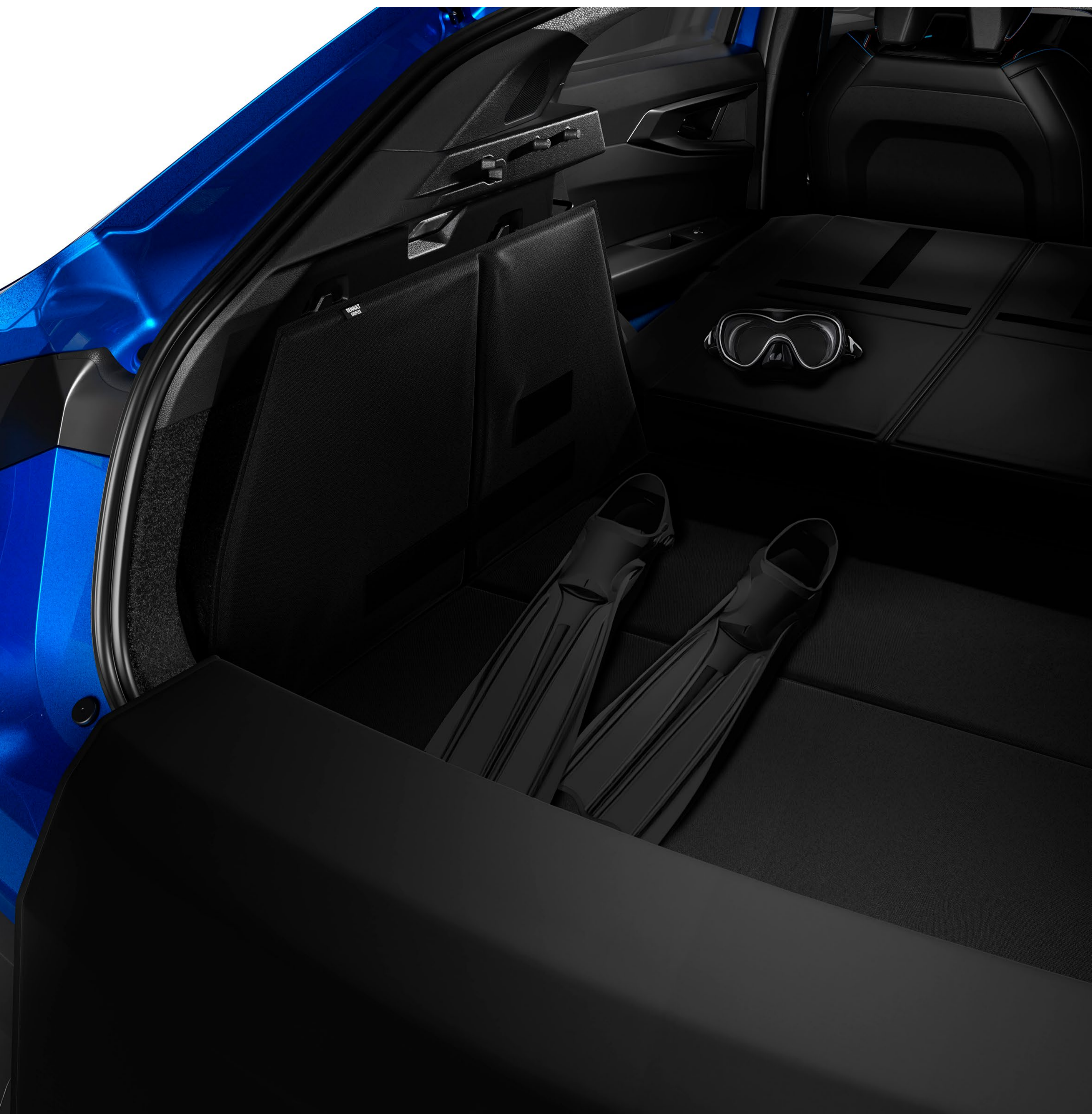
easyflex modulärt skydd för bagageutrymme

Njut av dina utomhusaktiviteter med easyflex vikbara, vattentäta och halkfria bagageutrymmesskydd. Det är modulärt och anpassar sig till de olika konfigurationerna av baksätet, vilket gör att både skrymmande och smutsiga föremål kan transporteras.