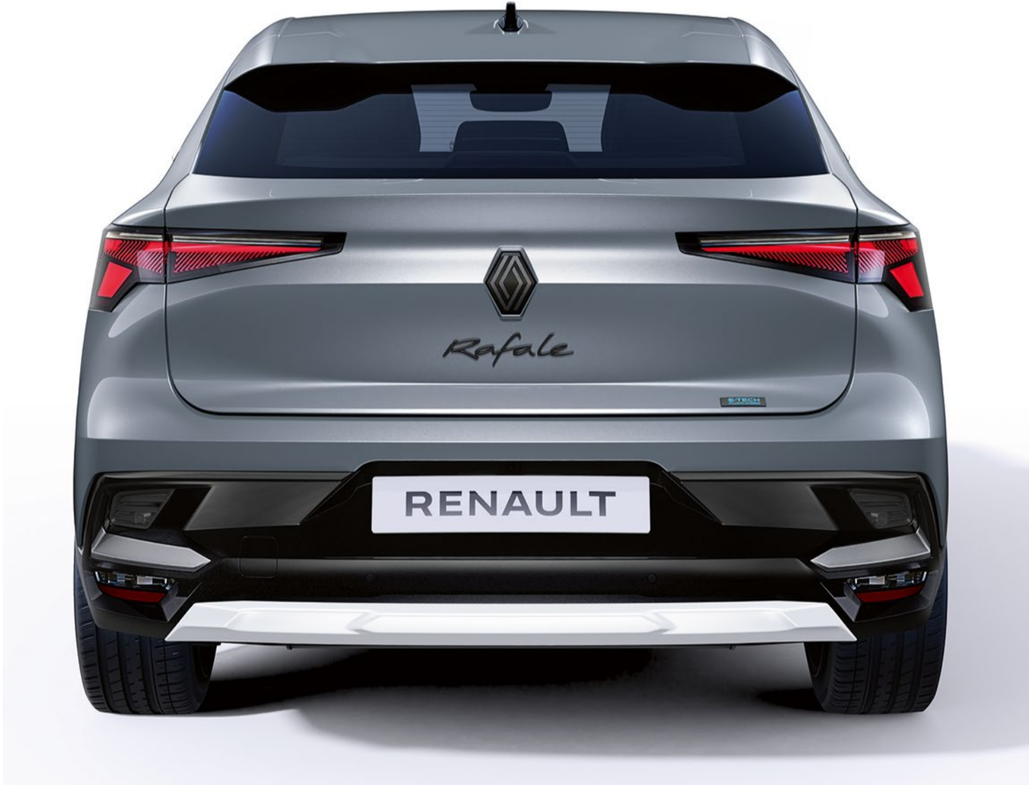
satin pearl white anpassningspaket, vy fram- och bakifrån

De vit- eller blåfärgade skydden till ytterbackspeglarna tillför en egen elegant touch.