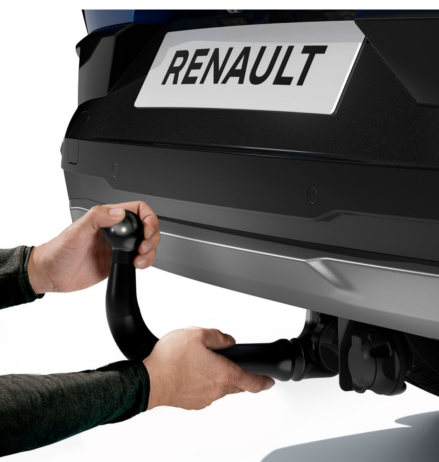
verktygslös avtagbar dragkrok

För tillfällig användning kan du använda den verktygslösa dragkroken med kullered. För frekvent användning väljer du den enkla och effektiva dragkroken med svanhals.