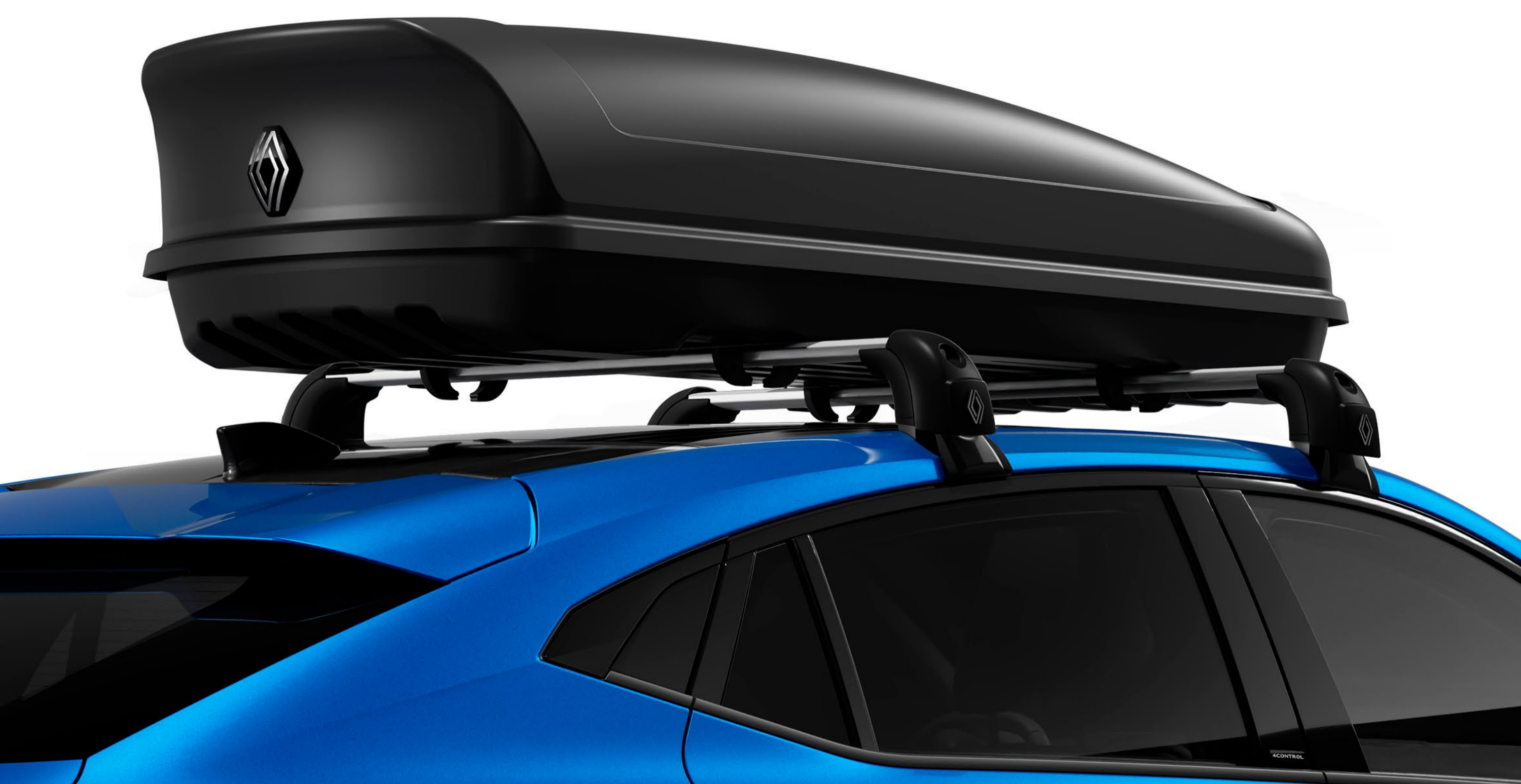
480-liters Renault takbox på takräcket

Renaults utbud av takboxar gör att du kan transportera upp till 630 liter. De är styva, låsbara och bevarar lyxkänslan inne i bilen genom att ta hand om allt extra bagage.