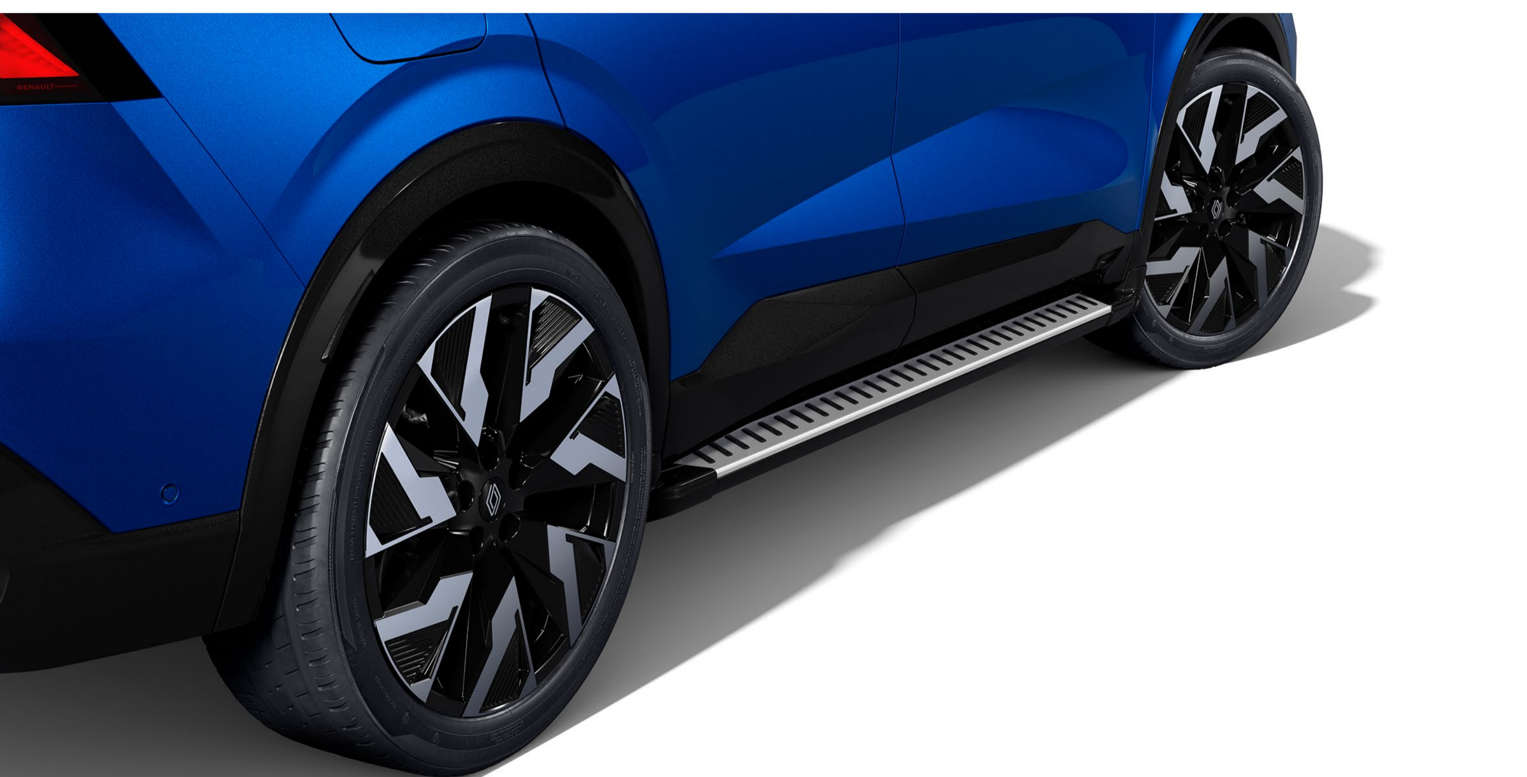
premiumpaket för sidotrösklar

De exklusivt designade sidotrösklarna förstärker den självsäkra stilen hos Renault Rafale. De underlättar åtkomsten till taket och skyddar karossen.