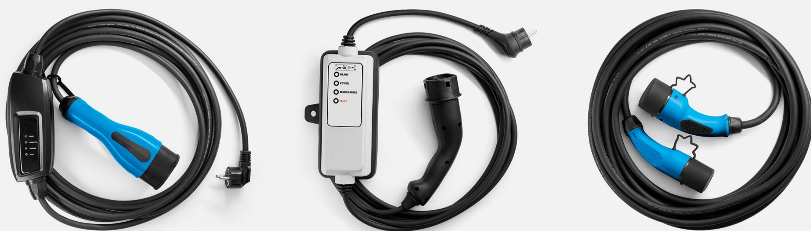
kabel för hushållsuttag, laddkabel för förstärkt hushållsuttag och kabel för laddningsstationer

Utnyttja flexicharger-kabeln som kan användas i ett förstärkt hushållsuttag, ibland hushållskabeln som är anpassad för användning med standarduttag. Laddkabel typ 2, för långa resor, används i offentliga och privata laddningsstationer.