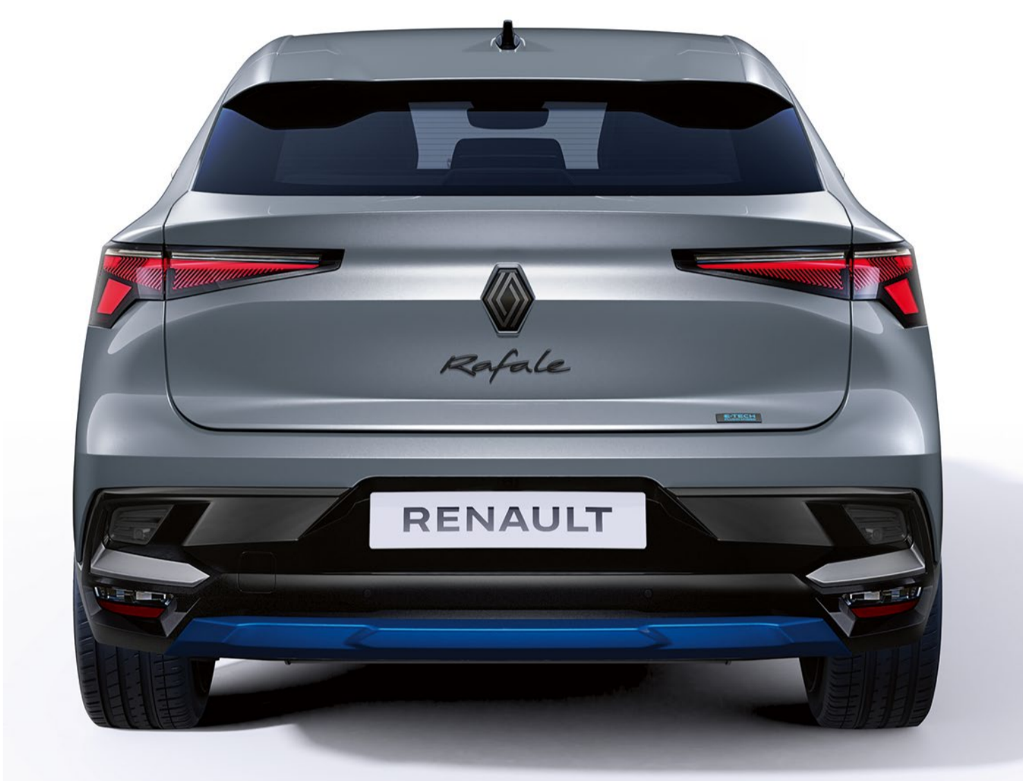
summit blue anpassningspaket, vy fram- och bakifrån