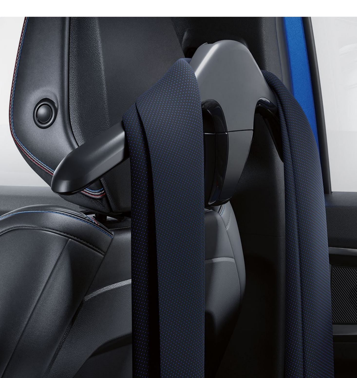
krok på multifunktionssystem

Kroken är lätt att fästa på ett av nackstöden och kan hålla en jacka eller kappa medan du är på resande fot. Den är praktisk och kan enkelt bytas ut mot en väskkrok eller en extra hylla.