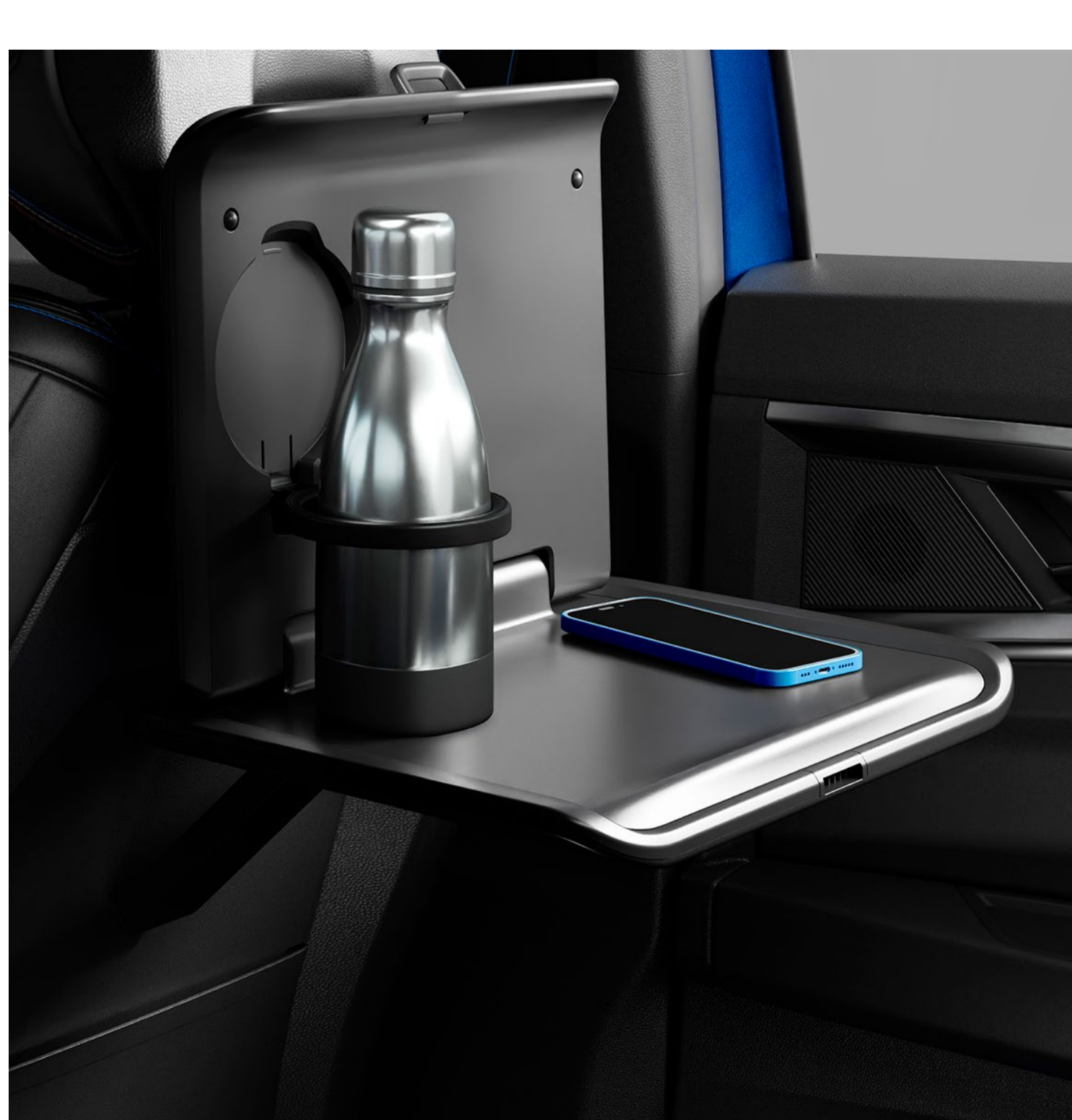
bakre fack på multifunktionssystem