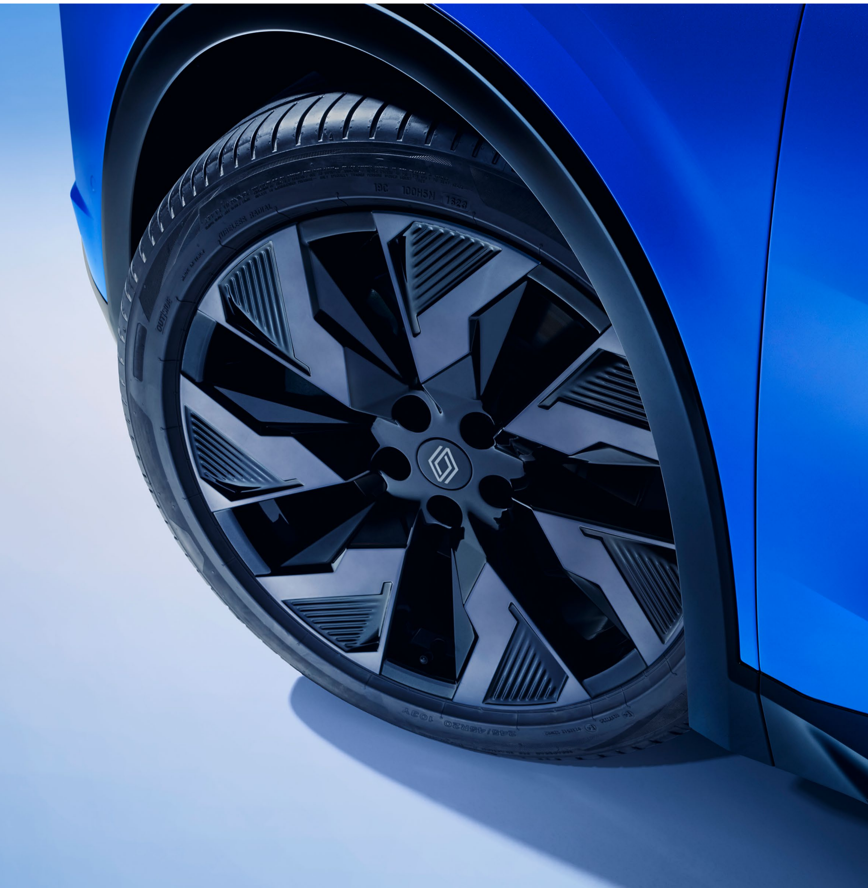
20 tums castellet lättmetallfälgar i svart diamantlook

För mer anpassning kan du välja från utbudet av snygga lättmetallfälgar: sonic 20 tum, castellet 20 tum eller chicane 21 tum.