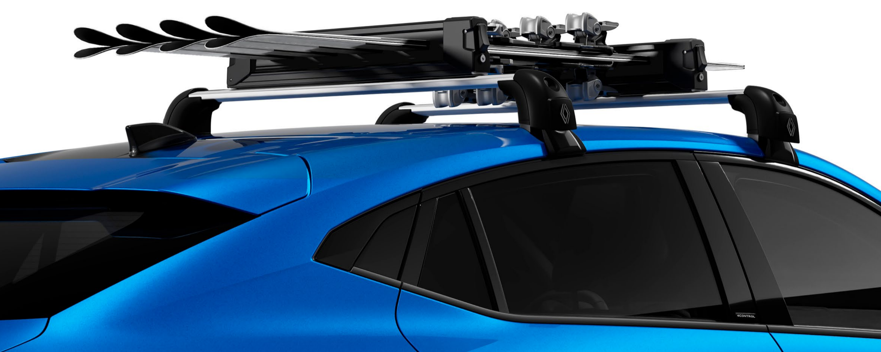
QuickFix-takräcken och skidhållare för fyra skidor

Ta med dig skidorna – transportera dem säkert med skidhållaren för biltaket.