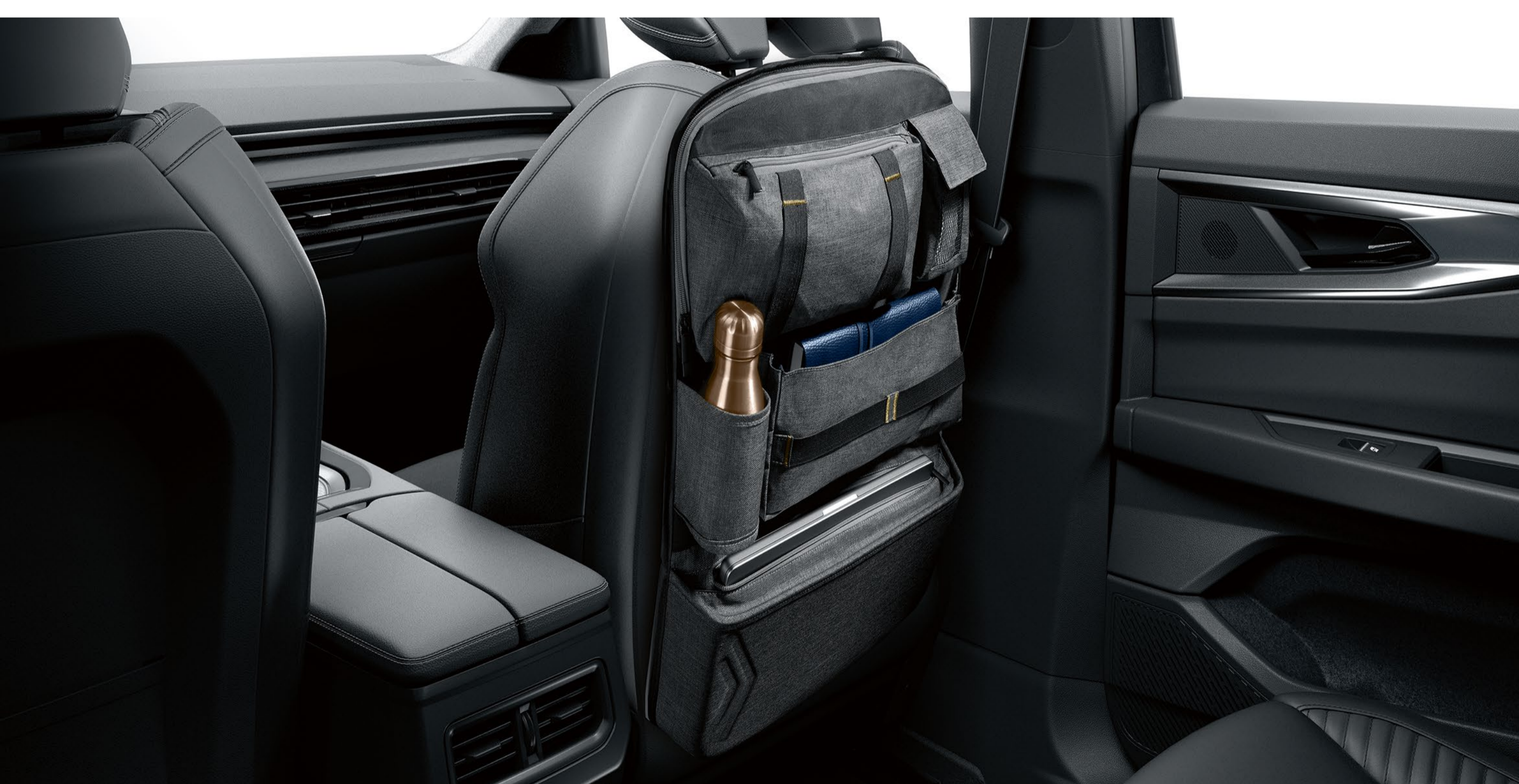
multifunktionell förvaring på framsätet

Bakom framsätet har multifunktionsförvaringen fem fickor för vardagsföremål och ett särskilt fack för en digital surfplatta. Den är gråmelerad, har guldsömmar och är försedd med Renault-logotypen.