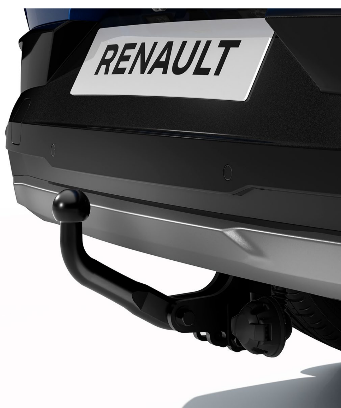
dragkrok med svanhals