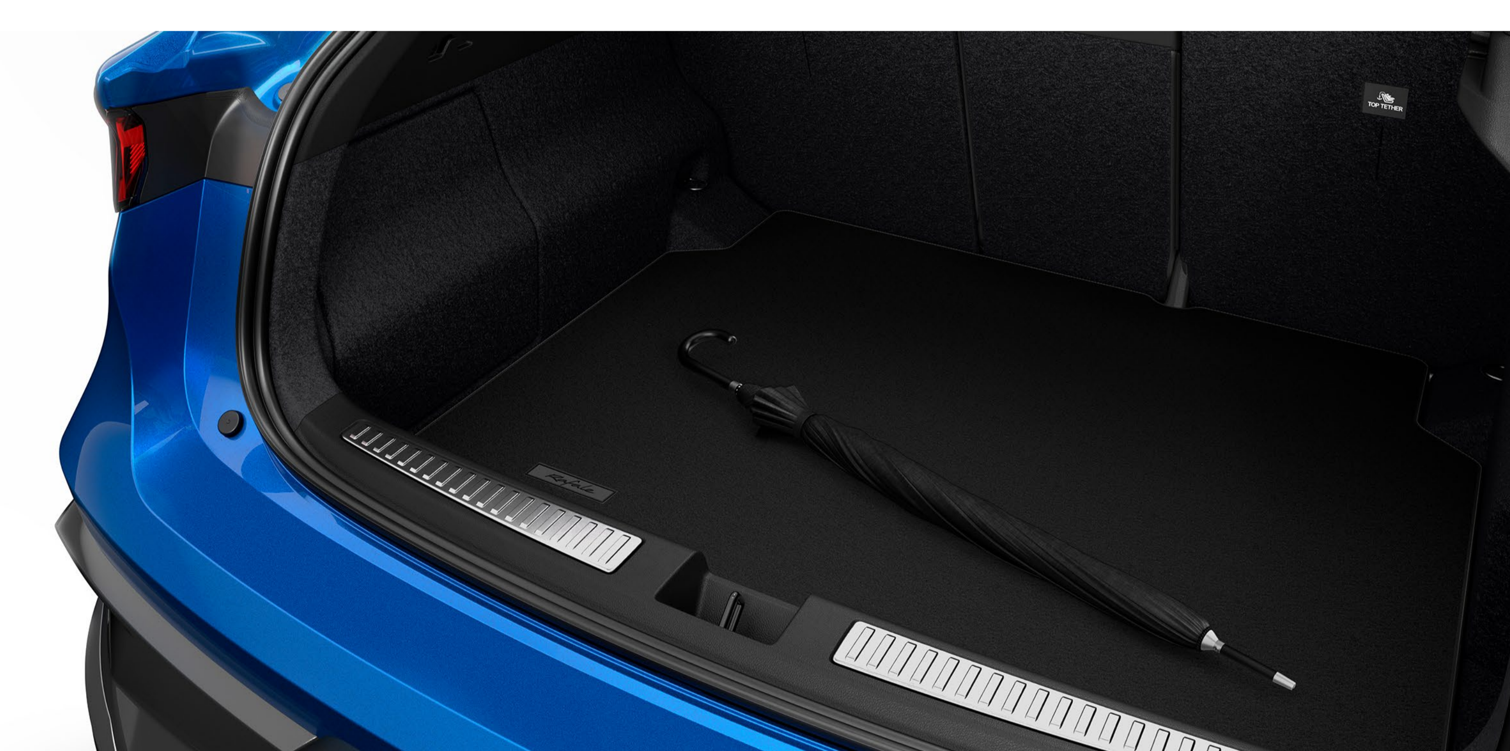
Bagageutrymmesmatta av premiumkvalitet och bagagetröskel i rostfritt stål

Bagageutrymmesmattan i premiumtextil pryder och skyddar bagageutrymmet på ett elegant sätt. Skräddarsydd med Rafale-märkning.