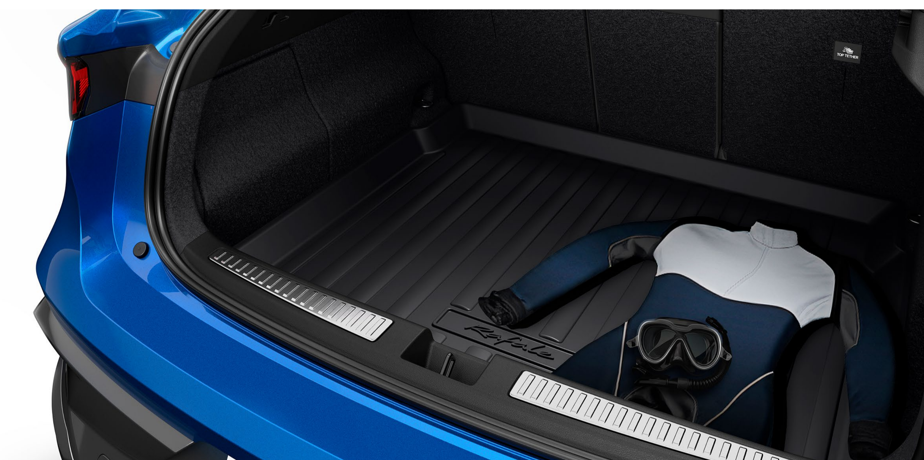
bagageutrymmesskydd och bagagetröskel i rostfritt stål

transportera smutsiga skor eller våta föremål i det täta och skålade bagageutrymmesskyddet; med sina upphöjda kanter skyddar det effektivt mattan i bagageutrymmet.