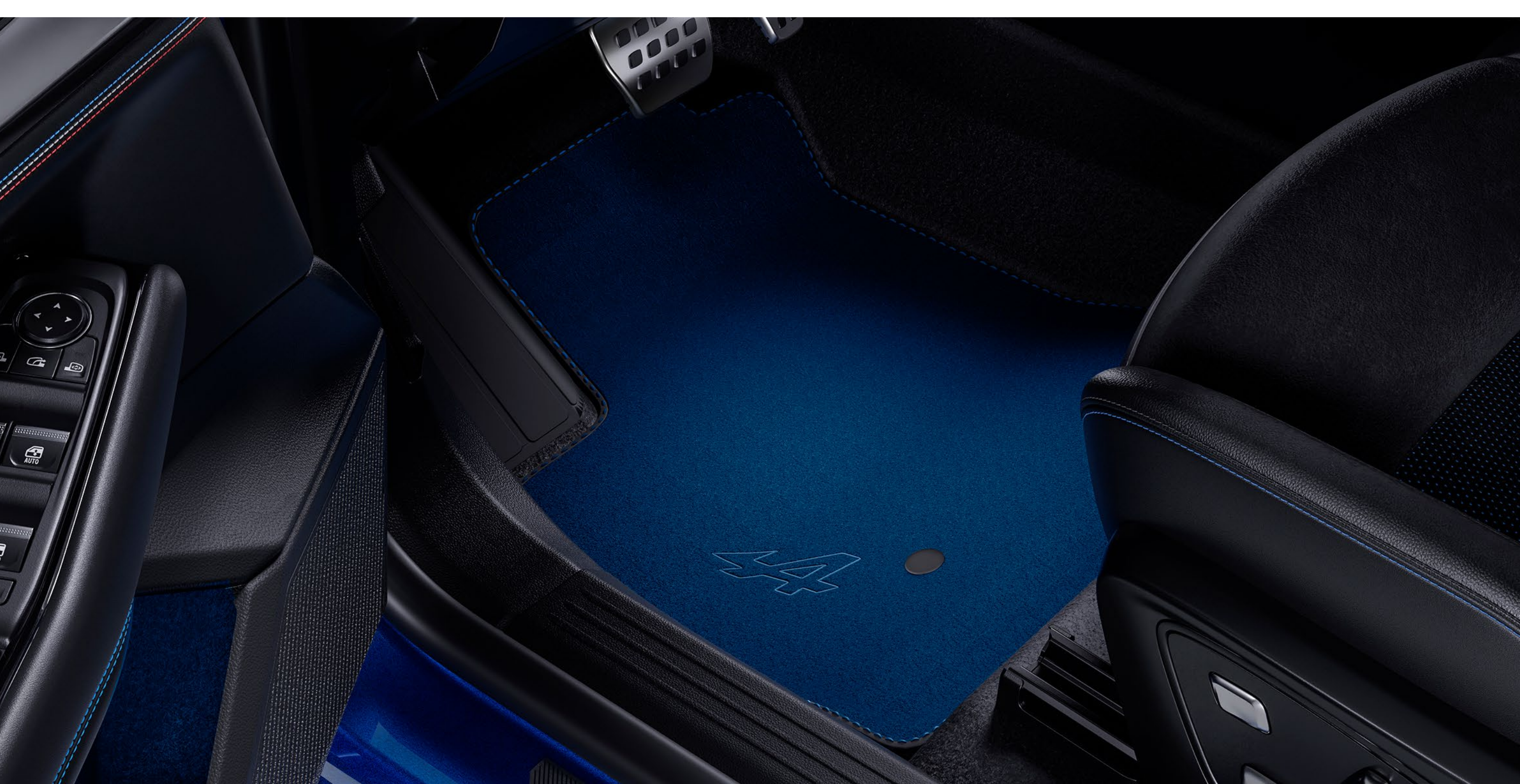
esprit Alpine-golvmattor i textil

Fyll passagerarutrymmet med Alpine-anda, med en uppsättning Alpine-broderade mattor i premiumkvalitet med blå highlights.