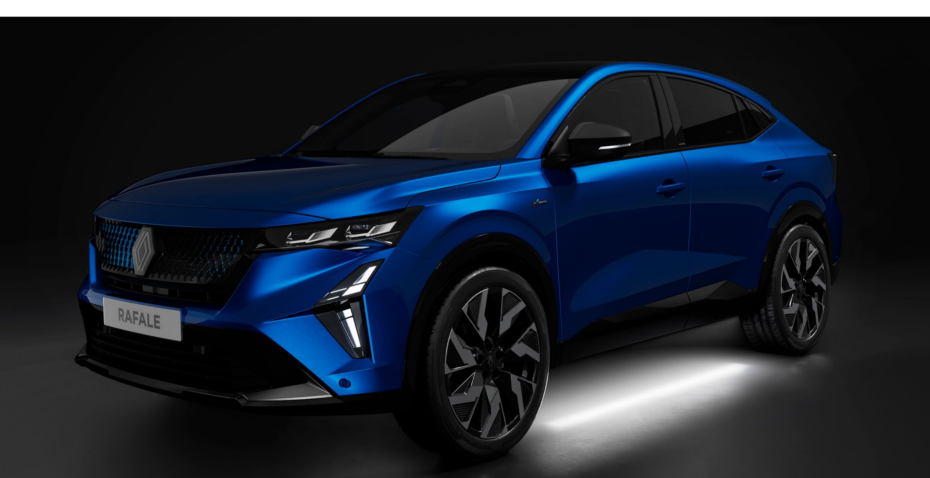
välkomstbelysning under karossen

Hitta ditt fordon enkelt på mörka parkeringsplatser. LED-belysningen under bilen aktiveras när du närmar dig och hälsar dig med elegans.