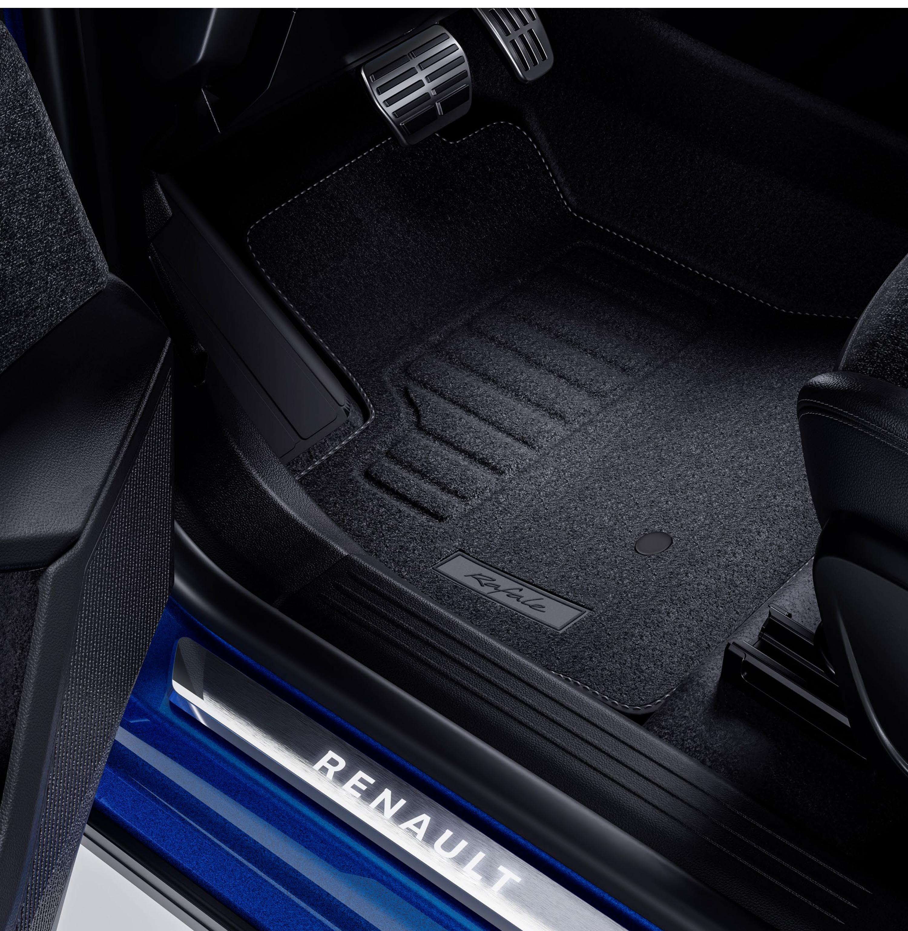
belysta dörrtrösklar från Renault, sportpedal och golvmattor i premiumtextil

De Renault-märkta trösklarna tillför stil till framdörrarnas nedre del, och lyser upp när dörrarna öppnas. På förarplatsen ger pedalstället i aluminium en sportig touch.