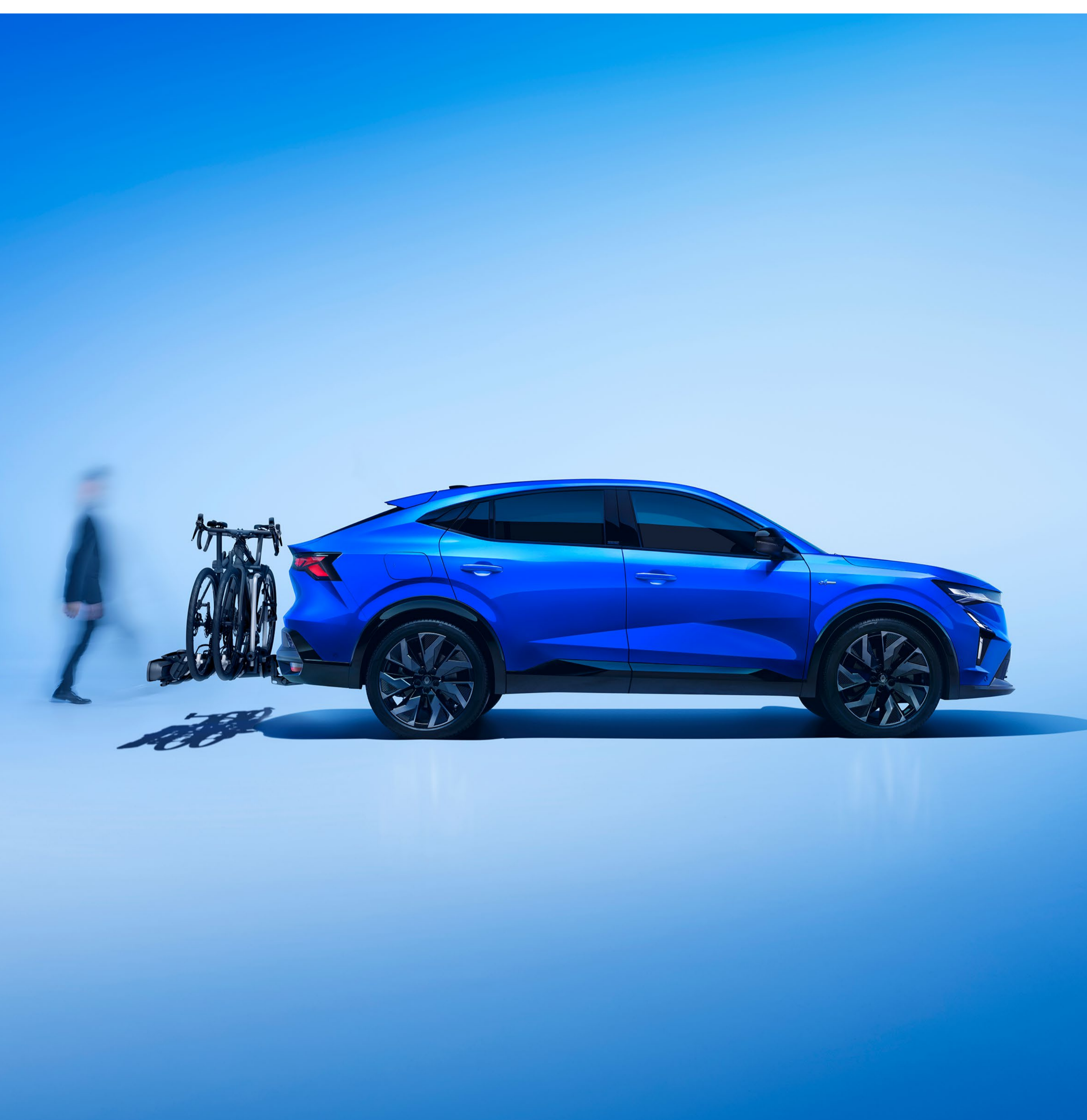
cykelhållare för tre cyklar på dragkrok

Utnyttja utbudet av dragkrokar som har utvecklats exklusivt för Renault Rafale.