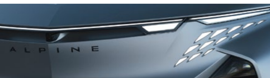
GRIS TONNERRE MAT [ATELIER LACK]