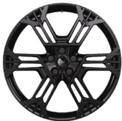
21" FORGED SNOWFLAKE MATTSVART [ATELIER FÄLG]