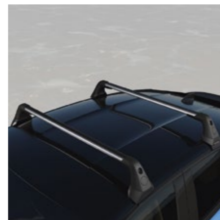
LASTRÄCKEN I ALUMINIUM