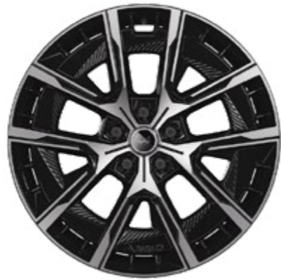
20" CRISTAL DIAMOND CUT