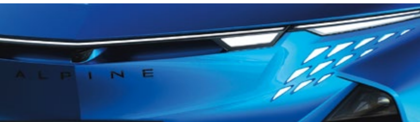
BLEU ALPINE VISION