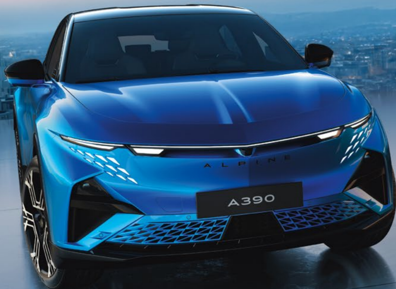
ALPINE A390 GTS *