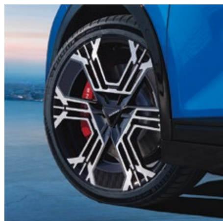
NAVKÅPA [21" FÄLGAR]