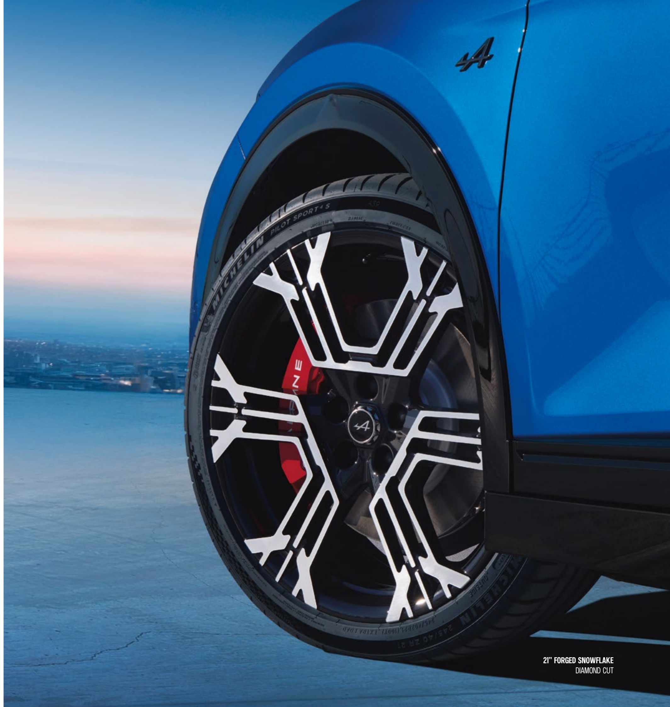
21" FORGED SNOWFLAKE DIAMOND CUT