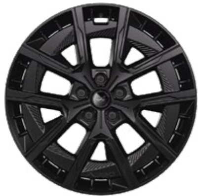
20" CRISTAL MATTSVART [ATELIER FÄLG]