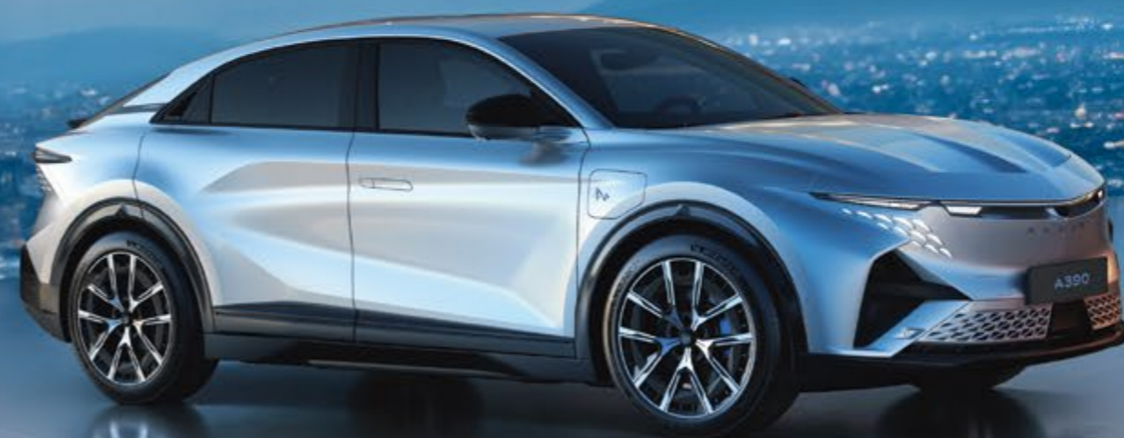
ALPINE A390 GT