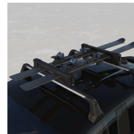
SKIDHÅLLARE [4 PAR] PÅ LASTRÄCKE