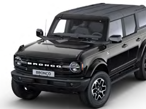
Shadow Black Metalliclack*