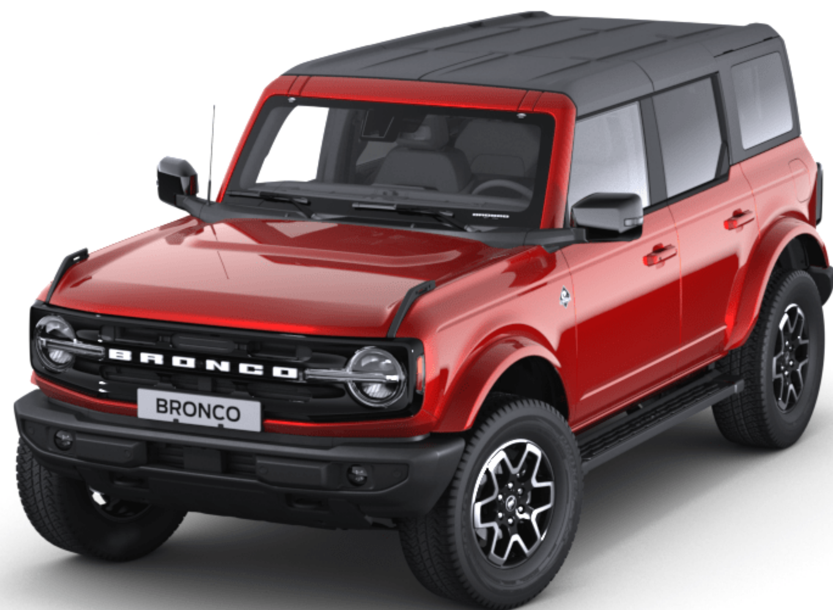
Hot Pepper Red Tonad klar metalliclack*

En speciell lackeringsprocess i flera steg ger Ford Bronco en hållbar exteriör. Vaxfyllda karosshållrum, ett skyddande täckskikt och nya appliceringsprocesser bidrar till att din nya Bronco ser lika elegant ut även efter många års användning.