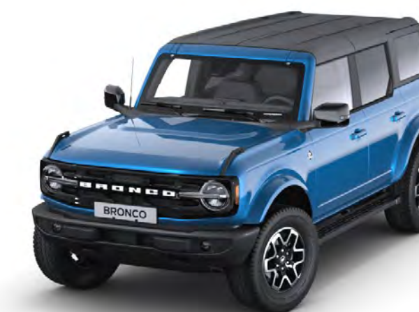
Velocity Blue Metalliclack*