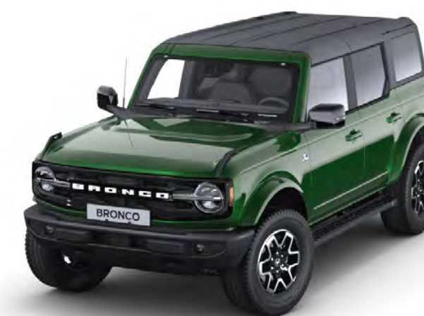
Eruption Green Metalliclack*