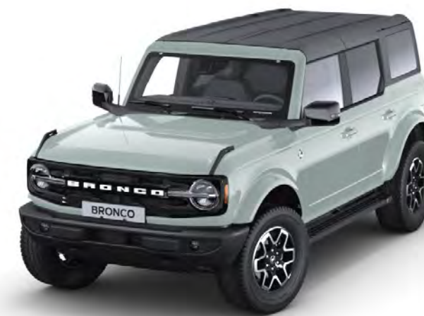
Cactus Grey Metalliclack*