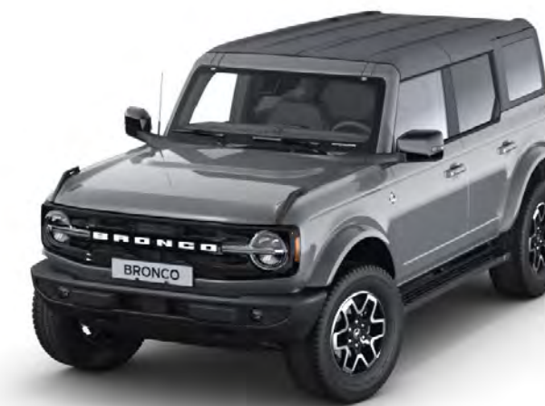
Carbonized Grey Metalliclack*