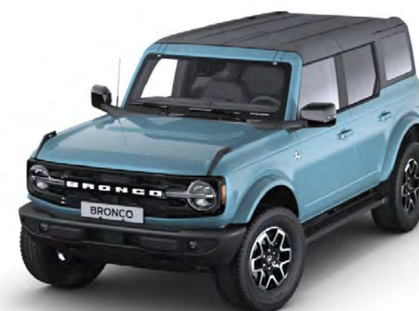
Area 51 Metalliclack*