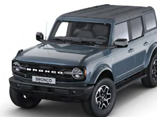
Azure Grey Metalliclack*