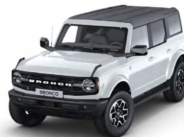
Oxford White Konventionell lack