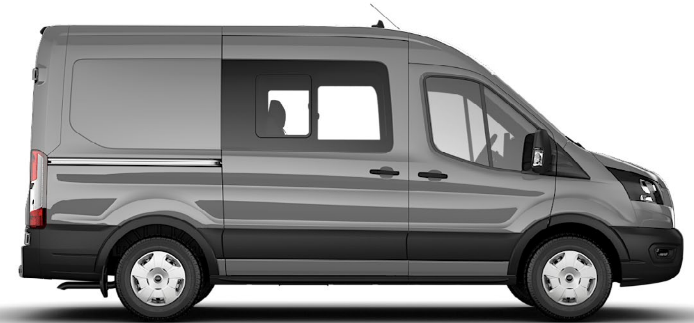
DUBBELHYTT I SKÅP