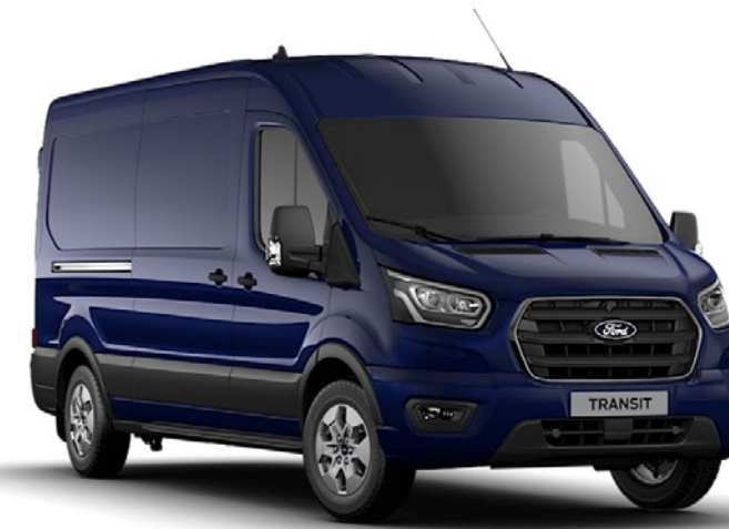
Blazer Blue Solid