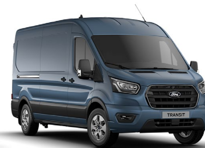
Chrome Blue Metalliclack*