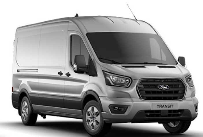
Moondust Silver Metalliclack*