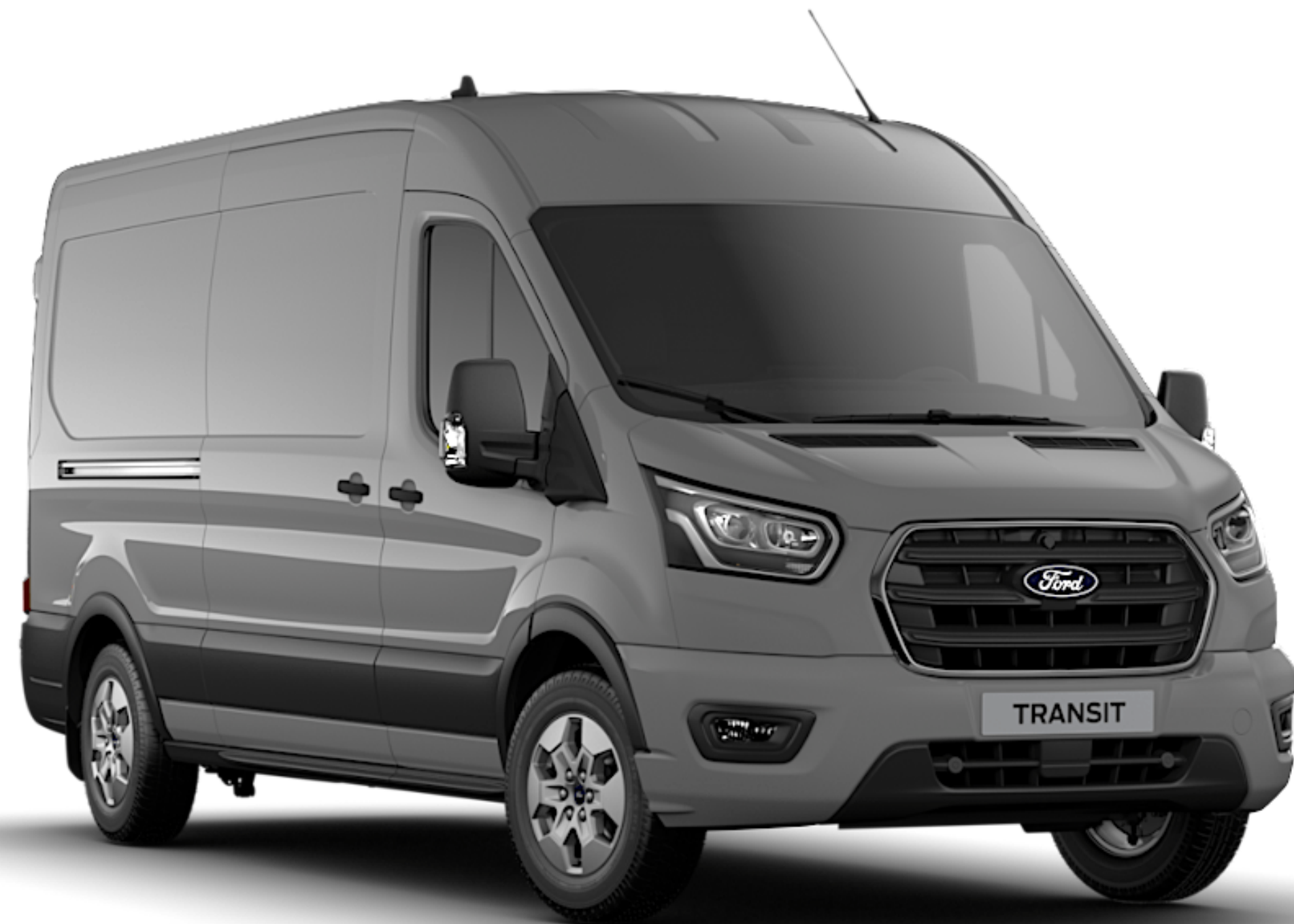
Grey Matter Premium Solid*

Ford Transit har en slitstark exteriör tack vare en speciell multi-stage lackeringsprocess, som säkerställer att fordonet behåller sitt utseende under många år.