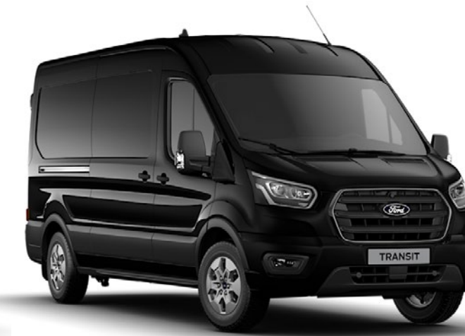
Agate Black Metalliclack*