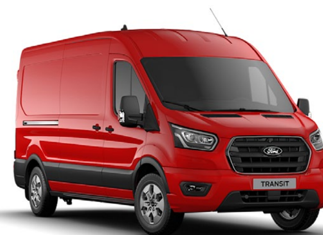
Race Red Solid

Anm. Bilderna är endast avsedda som illustration av karossfärgerna och kan avvika från den bil som beskrivs. Färger och klädselar som återges i broschyren kan av trycktekniska skäl avvika från de faktiska färgerna.