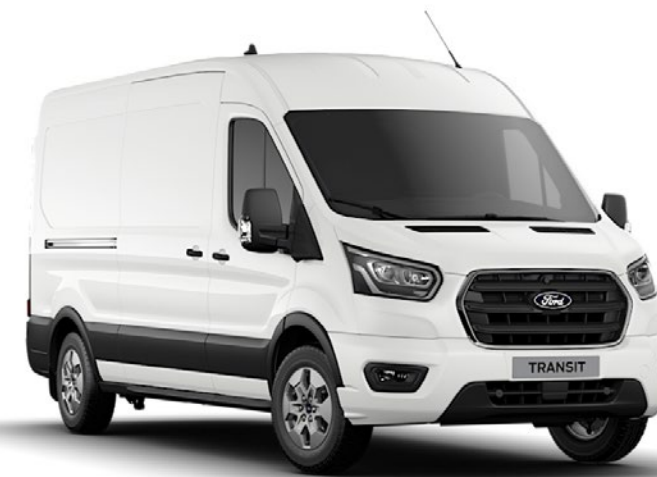
Frozen White Solid