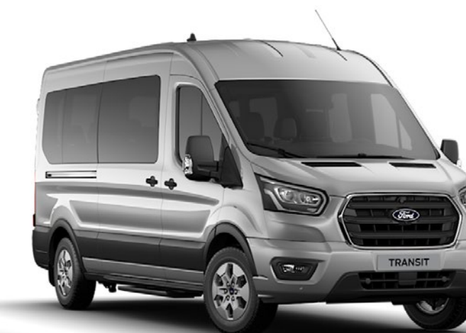
Moondust Silver Metalliclack*