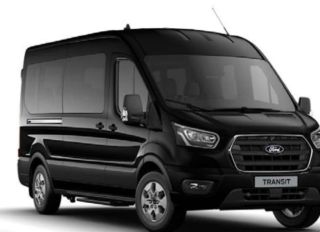
Agate Black Metalliclack*