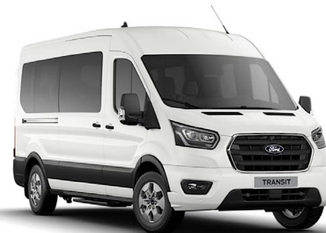
Frozen White Solid