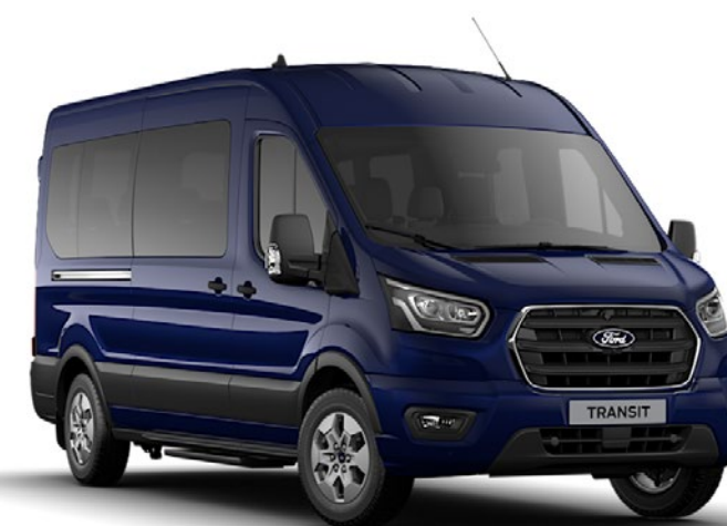
Blazer Blue Solid