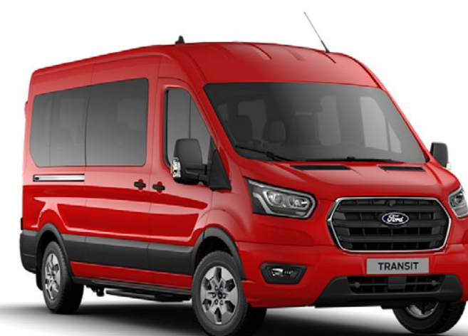
Race Red Solid

Anm. Bilderna är endast avsedda som illustration av karosfärgerna och kan avvika från den bil som beskrivs. Färger och klädselar som återges i broschyren kan av trycktekniska skäl avvika från de faktiska färgerna.