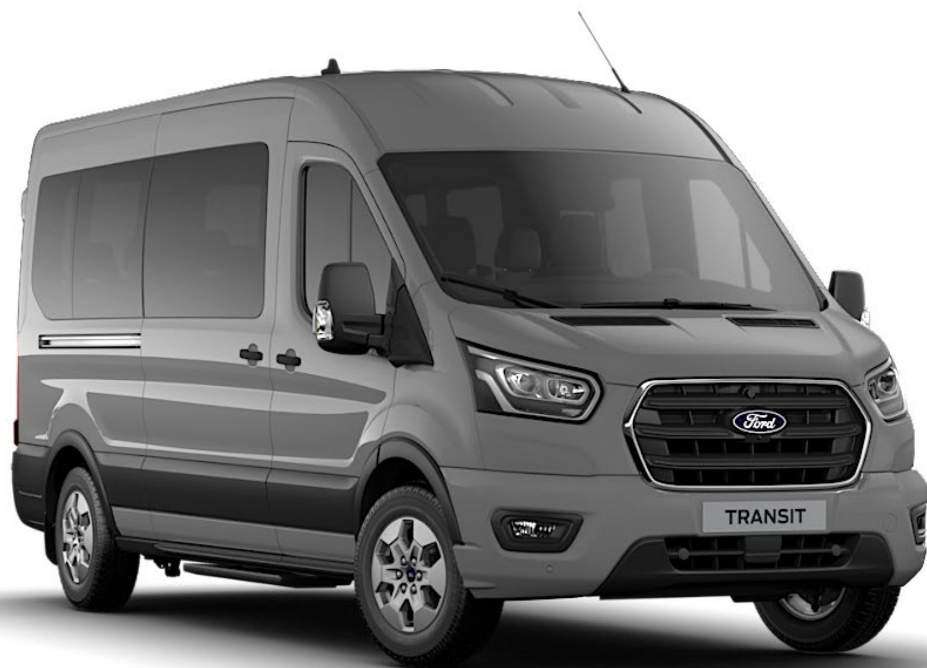
Grey Matter Premium Solid*

Ford Transit har en slitstark exteriör tack vare en speciell multi-stage lackeringsprocess, som säkerställer att fordonet behåller sitt utseende under många år.