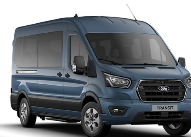
Chrome Blue Metalliclack*