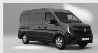
Sort pearl black