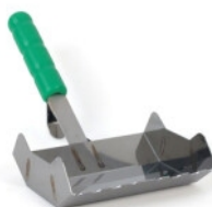
KS Limske LF