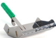
KS Limske LF