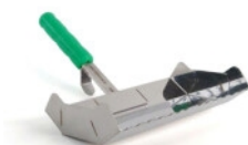
KS Limske LF