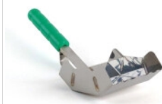
KS Limske LF