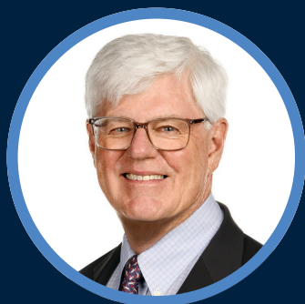
HON. JOHN P. MANLEY PC, O.C., F.ICD

« Le Congrès annuel de l'IAS permet aux administrateurs d'obtenir un aperçu de l'avenir afin d'examiner les problèmes et les défis qui se profilent à l'horizon. »