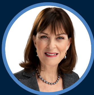
DRE HEATHER MUNROE-BLUM O.C., OQ, F.ICD

« Le Congrès annuel de l'IAS permet aux administrateurs d'obtenir un aperçu de l'avenir afin d'examiner les problèmes et les défis qui se profilent à l'horizon. »