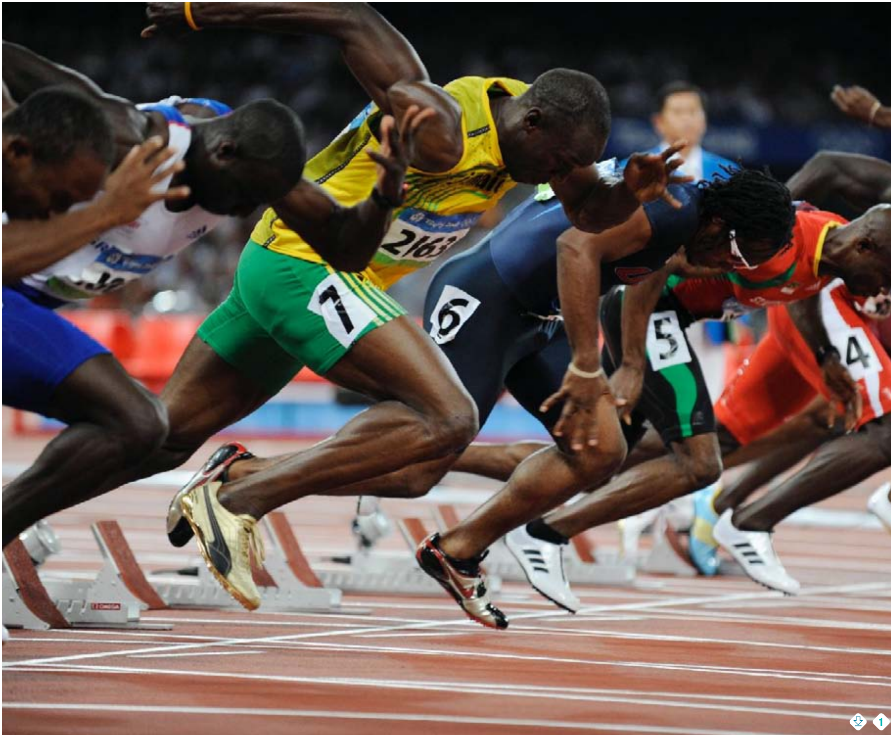
1. Olympische Spiele von Beijing 2008. Leichtathletik. 100 m Männer – Halbfinale, Start.