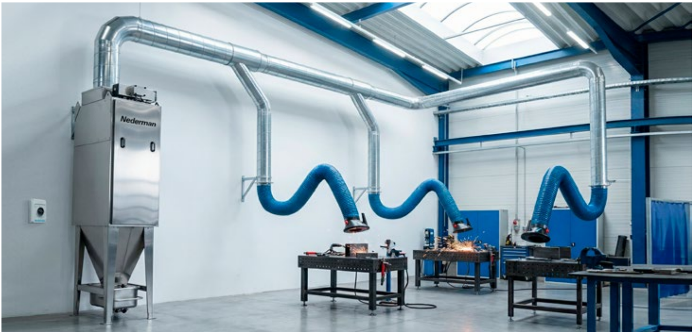
Instalação típica do filtro MCP com vários pontos de captação com braços extratores, tubulação de interligação e ventilador integrado.

A Nederman fabrica tudo o que é necessário para capturar, transportar, coletar e manter o sistema de filtragem de forma eficaz, atingindo o desempenho desejado e garantindo que se mantenha em conformidade com todas as exigências técnicas e regulamentos locais. A Nederman também pode fornecer uma solução "turnkey", incluindo serviços de gerenciamento de projetos, instalação e o comissionamento de todo o sistema centralizando num único fornecedor a interface do cliente.