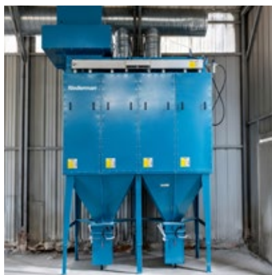
MCP-8-32S pó a granel