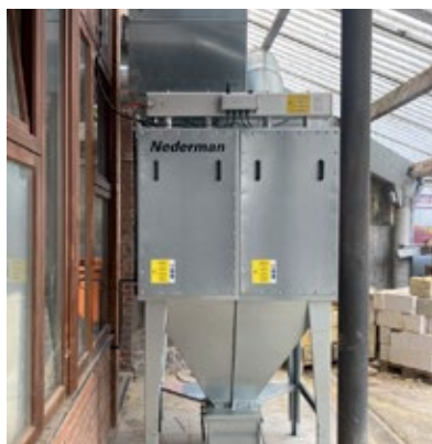
MCP-4-16SL soldagem de produção