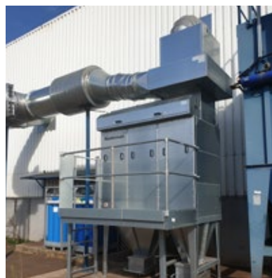
MCP-6-24S corte a laser