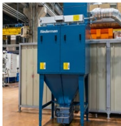
MCP-4-16SL corte de metal