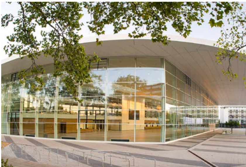
Vom 21. bis 23. April wird das Essener Messegelände zum Puls der ALTENPFLEGE.