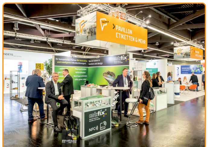
Beispielhafte Darstellungen, kein Rechtsanspruch.