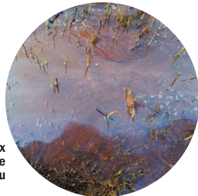
Reflet huileux à la surface de l'eau