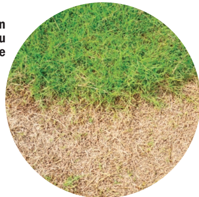
Végétation morte ou décolorée