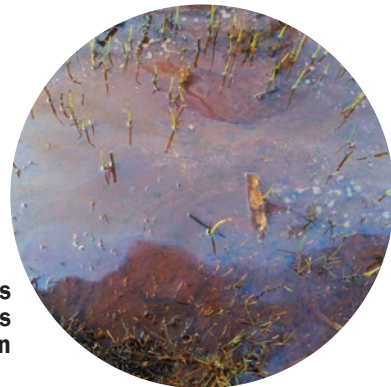
Olajos csillogás vízen