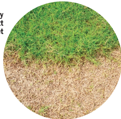
Elhalt vagy elszíneződött növényzet