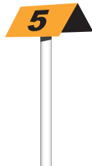
CSővezeték ellenőrzési síkjelölése