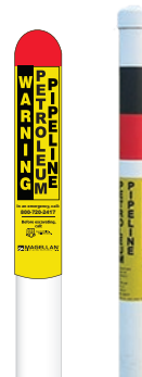
Festett fém vagy műanyag oszlopok