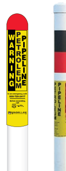
塗装された金属またはプラスチックの杭