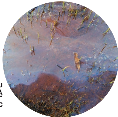
Váng dầu nổi trên bề mặt nước