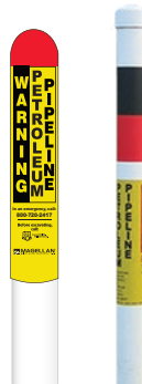
Cột kim loại hoặc cột nhựa được sơn