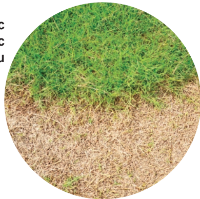
Thảm thực vật chết hoặc bạc màu