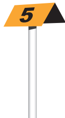
Cột mốc cho máy bay tuần tra đường ống