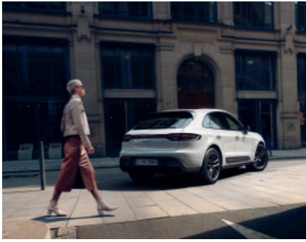
Macan T – noch mehr Dynamik Seite 9