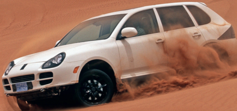
Dünen-Erprobung im heissen Dubai: Härtestest für das Projekt «Colorado» Anfang der 2000er-Jahre