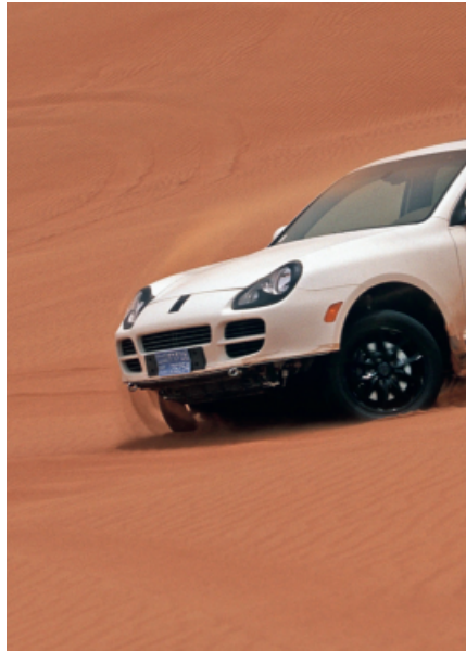
20 Jahre Offroad-Spass mit Porsche Cayenne Seite 12