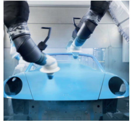
Porsche Kunden werden zu Farbdesignern Seite 18