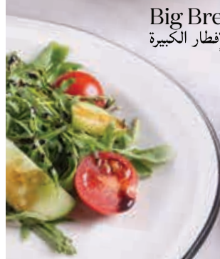
Big Breakfast وجبة الإفطار الكبيرة