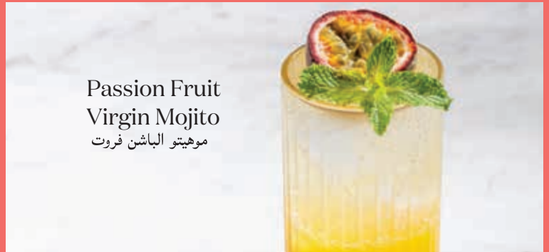
Passion Fruit Virgin Mojito موهيتو الباشن فروت

فراولة طازجة وشراب الليمون، وأوراق نعناع، ومشروب سفن اب