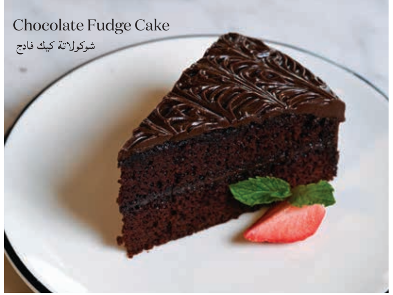
Chocolate Fudge Cake شوكولاتة كيك فادج

تيراميسو Coffee soaked savoiardi biscuits layered with mascarpone topped with cocoa powder. بسكويت سافوياردي منقوع في القهوة ومغطى بطبقات من الكريمة والماسكاربونى ومزين بمسحوق الكاكاو