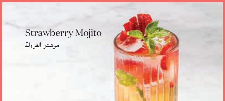
Strawberry Mojito موهيتو الفراولة