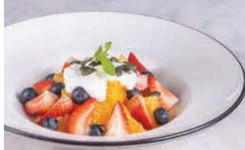
Fresh Fruit Salad سلطة فواكه طازجة