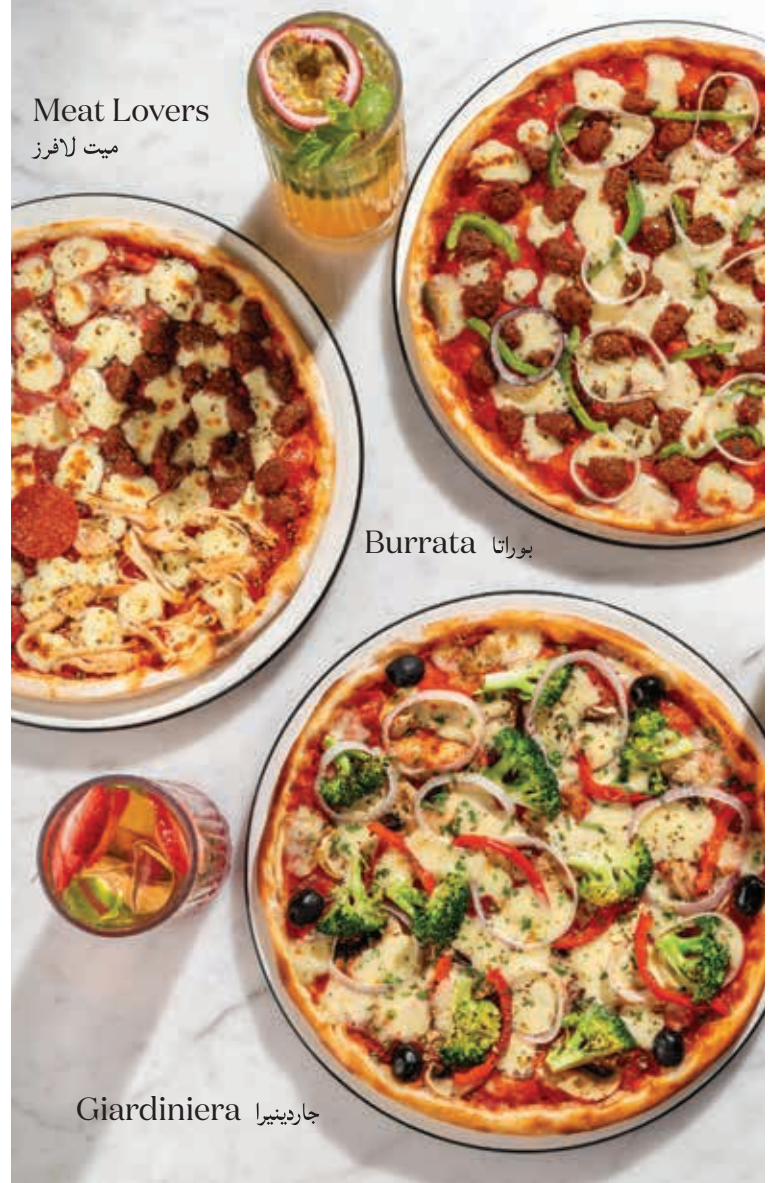
Meat Lovers ميت لافرز