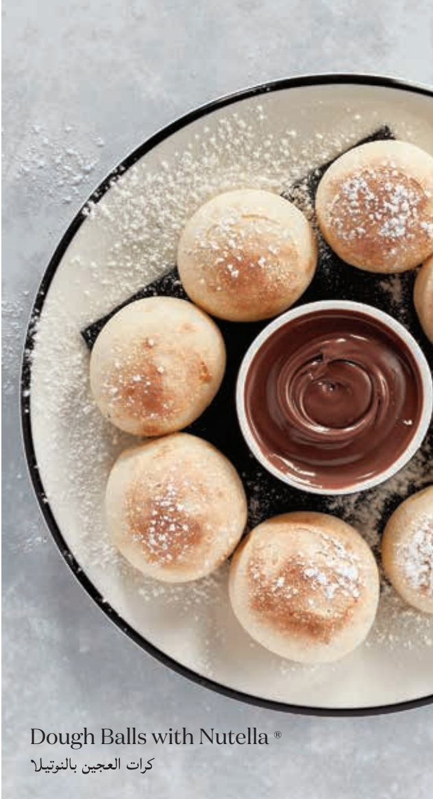
Dough Balls with Nutella® كرات العجين بالنوتيلا