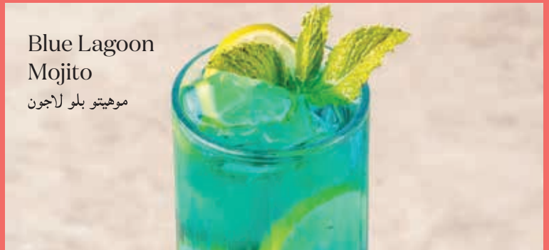
Blue Lagoon Mojito موهيتو بلو لاجون