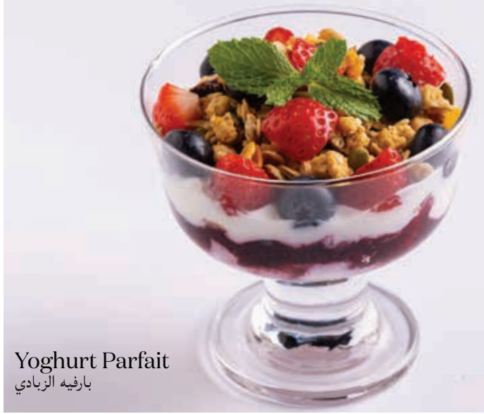
Yoghurt Parfait بارفيه الزبادي