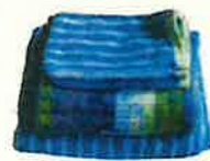
Linge de toilette