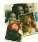
Photos, dessins d'enfants