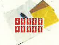
Nécessaire de courrier

Emballer les aliments dans des boîtes en plastique transparent ou des sachets plastiques (type sachets de congélation) fermés avec des élastiques ou des liens sans métal