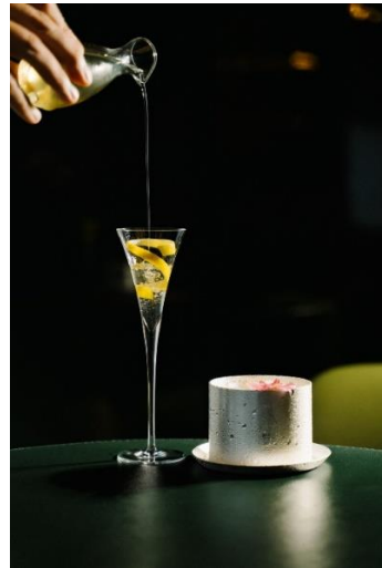
香港奕居雞尾酒：馬提尼