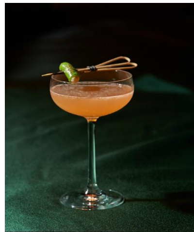
成都博舍雞尾酒：海椒市