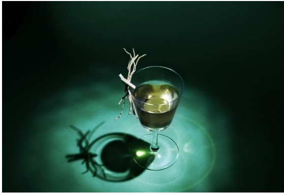
北京瑜舍雞尾酒：木屋子