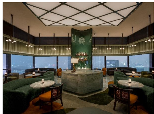
香港奕居 Salisterra Green Room