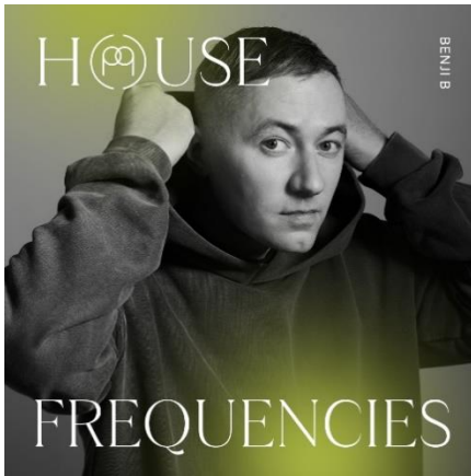
Global Nomads 文化創造者: Benji B