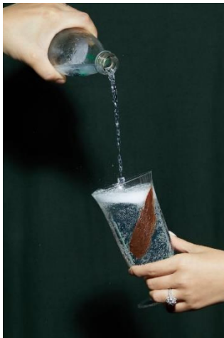
上海鑛舍雞尾酒：上海咖啡嗨棒