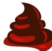
粪便中带有鲜红 血液