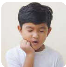
Bengkak pada kelenjar air liur