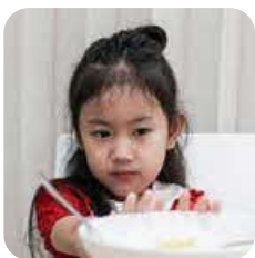
Hilang selera makan