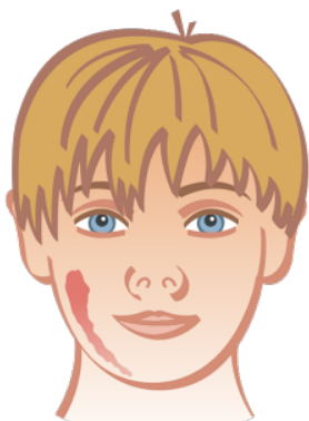
Kelenjar parotid yang sihat dan normal

Individu yang menghidap beguk biasanya mula berasa tidak sihat dengan gejala tidak khusus seperti sakit kepala, hilang selera makan, dan demam ringan.