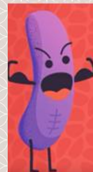
MDR-TB ubat pengambilan selama 20 hingga 24 bulan