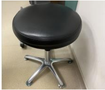
Kerusi yang beroda atau kerusi tanpa sandaran