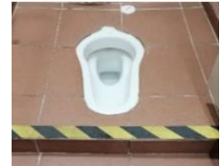
Elakkan menggunakan tandas mencangkung jika anda mempunyai kaki lemah atau berjalan yang tidak stabil