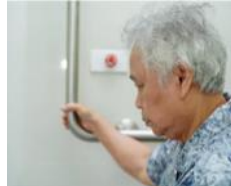
Sokong diri anda dengan memegang susur tangan di tandas