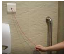
Tarik Loceng Panggilan Untuk Meminta Bantuan