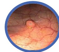
Jelito grube polip