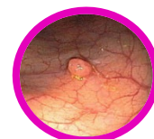
Polip jelita grubego