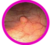
Pólipo en colon