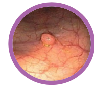
Pólipo en colon