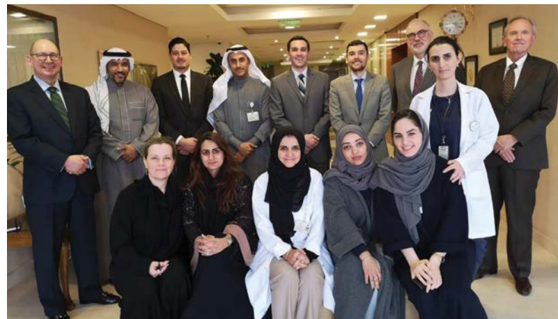
El equipo de expertos de UChicago Medicine visitó Almoosa Specialty Hospital para hacer un análisis de diferencias