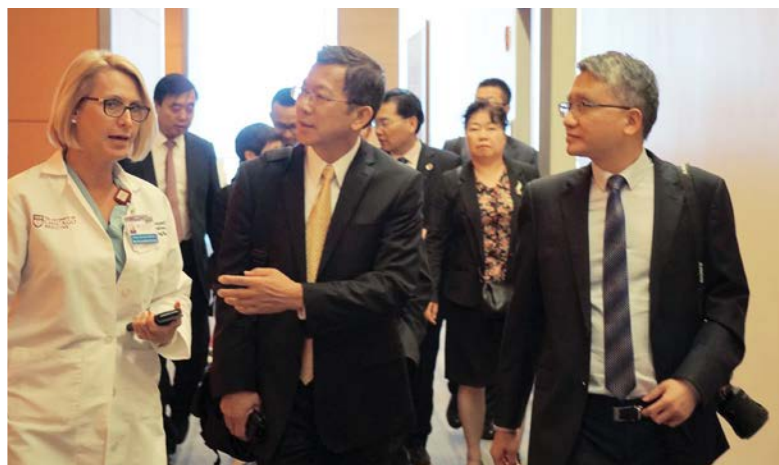
2018 Capacitación global para ejecutivos de la salud