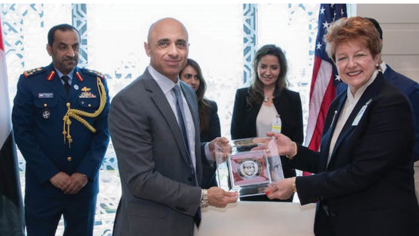
University of Chicago Medicine mantiene un convenio para estar entre los siete hospitales principales en Estados Unidos para dar tratamiento médico especializado a pacientes de los Emiratos Árabes Unidos (EAU). Yousef Al Otaiba, embajador de los EAU en Estados Unidos (izquierda) y Sharon O'Keefe, presidenta de UChicago Medical Center (derecha).

UChicago Medicine atiende a cientos de pacientes de más de 75 países del mundo. Mientras nuestro equipo de médicos ofrece atención clínica de clase mundial a todos esos pacientes, la Oficina de Programas Internacionales les da a los pacientes internacionales una experiencia excepcional con servicios personalizados que cumplen con sus necesidades culturales, religiosas y lingüísticas.