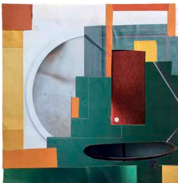
↑ Elisabeth Wild Sin título , 2017 Collage 23,5 x 23,5 cm