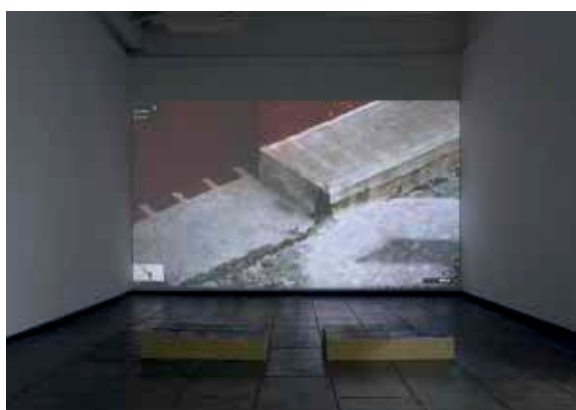
↑ Patricia Esquivias Walking Still , 2014 Videoinstalación Dimensiones variables

SH3 galeria@estranydelamota.com / mail@janiceguy.com estranydelamota.com / janiceguy.com BARCELONA / NUEVA YORK