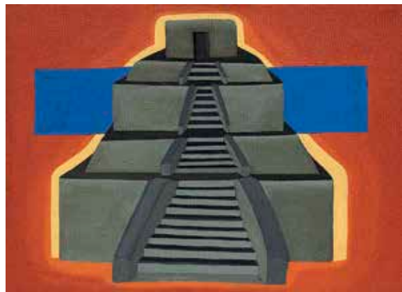
↑ Magdalena Jitrik Templo , 2010 Pintura 25 x 35 x 2 cm