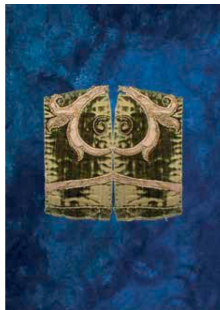
↑ Gala Porras-Kim Italian fragment from the MET mirrored , 2018 Dibujo sobre papel 28 x 20 cm

SH8 we@commonwealthandcouncil.com commonwealthandcouncil.com LOS ÁNGELES