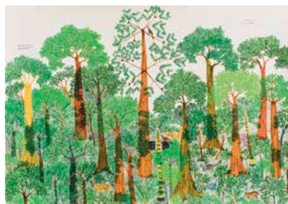
↑ Abel Rodríguez Terraza alta , 2018 Dibujo sobre papel 71 x 102 cm

SH9 info@institutodevision.com institutodevision.com BOGOTÁ