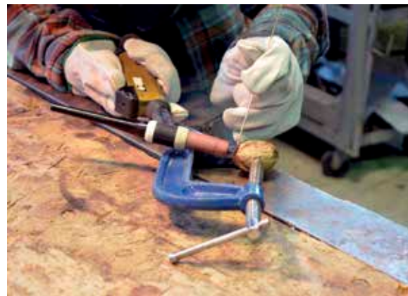
↑ Eduardo Navarro Letters to Earth , 2017 Bronce y núcleo de nogal 100 piezas de 5 x 4 x 4 cm c/u