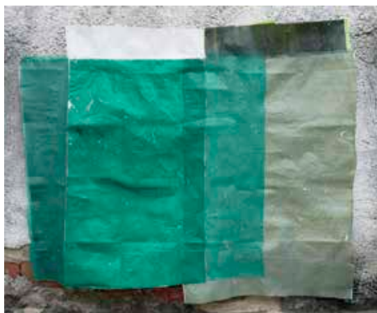
↑ Esmelyn Miranda Sin título (de la serie Construcción informal ), 2017 Técnica mixta 170 x 225 cm

SH1 info@carmenarajuarte.com carmenarajuarte.com CARACAS