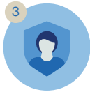
Perlindungan jiwa yang menyeluruh

Namun, kami juga paham tak sedikit yang merasa khawatir apakah perlindungan finansial yang dipilih dapat memberikan perlindungan optimal dalam jangka panjang sekaligus rasa tenang di masa depan.