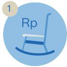
Kehidupan pensiun yang nyaman

Kami memahami Anda menginginkan yang terbaik untuk diri sendiri maupun keluarga. Anda dapat memulai dengan mempersiapkan perencanaan keuangan jangka panjang untuk masa depan yang lebih baik seperti: