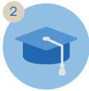
Pendidikan terbaik untuk anak