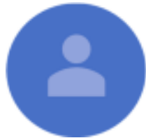
يحدد لاحقاً ممثل دائرة المالية في حكومة دبي