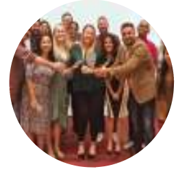
فريق خدمة النظام