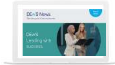
الصحيفة الإلكترونية لنظام مدخرات الموظفين في إمارة دبي