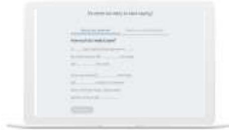
اللآلات الحاسبة والأدوات